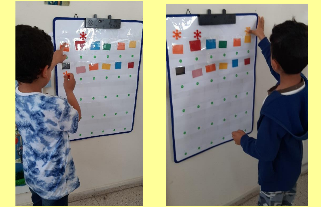
Τοίχος που μιλά