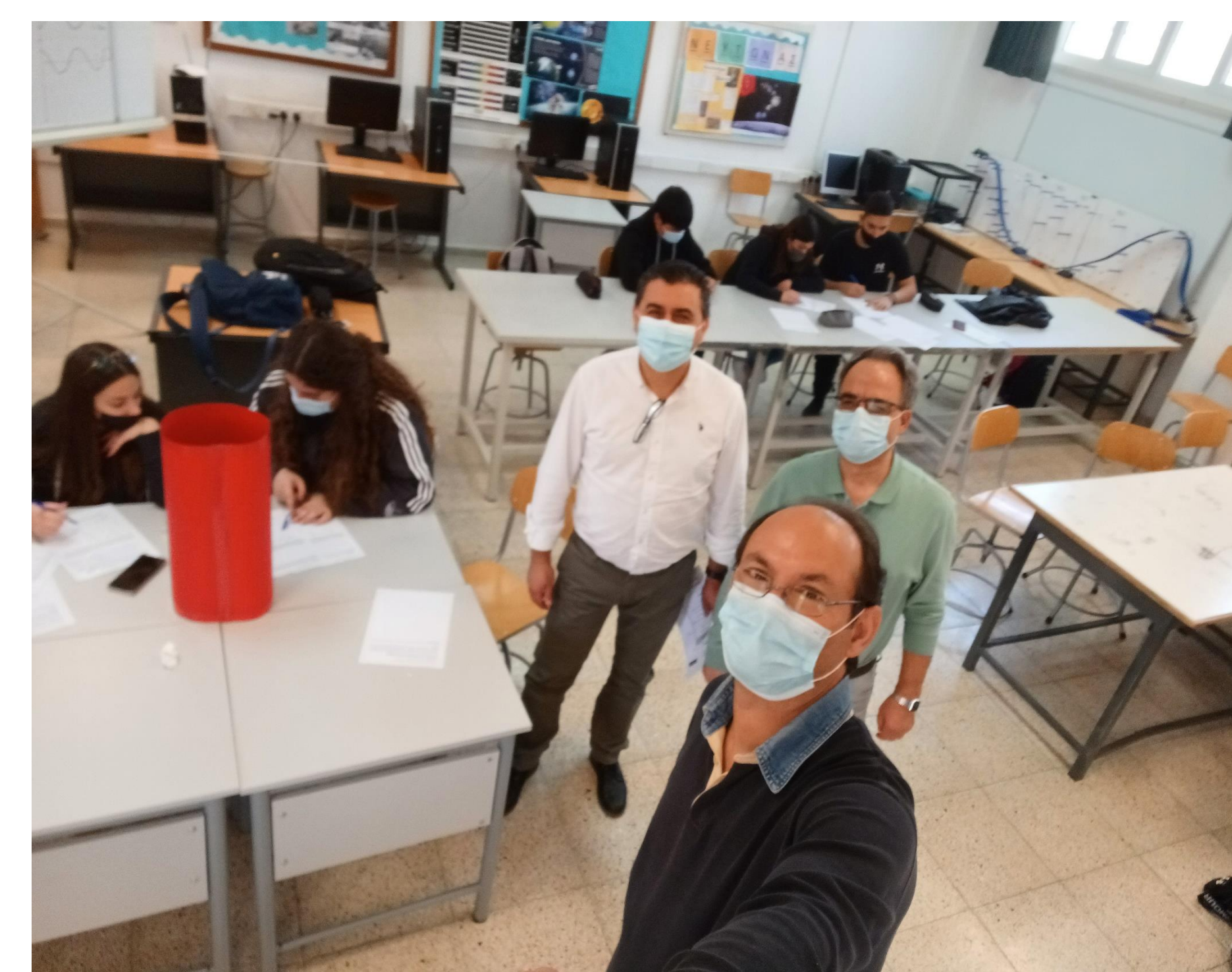
Ετοιμασία διδακτικού σεναρίου