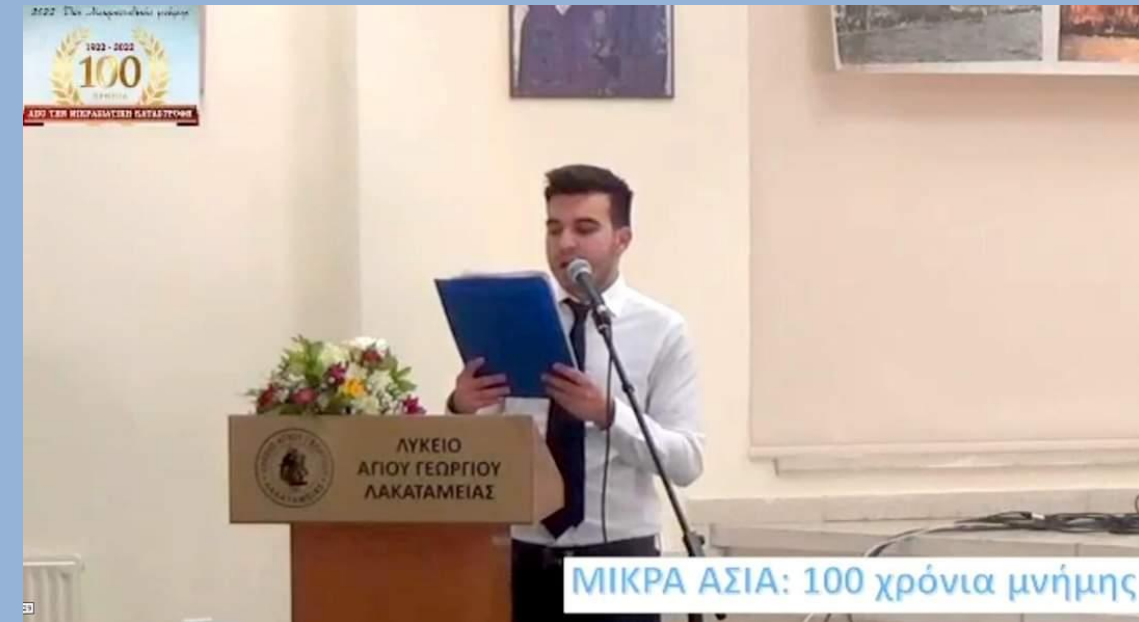
Μαθητικό Συνέδριο του Σχολείου «Μικρά Ασία, 100 χρόνια μνήμης»