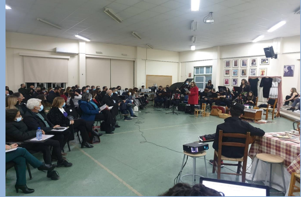
Θεατρική παράσταση του Σχολείου «Σμύρνη, Συγγνώμη...»