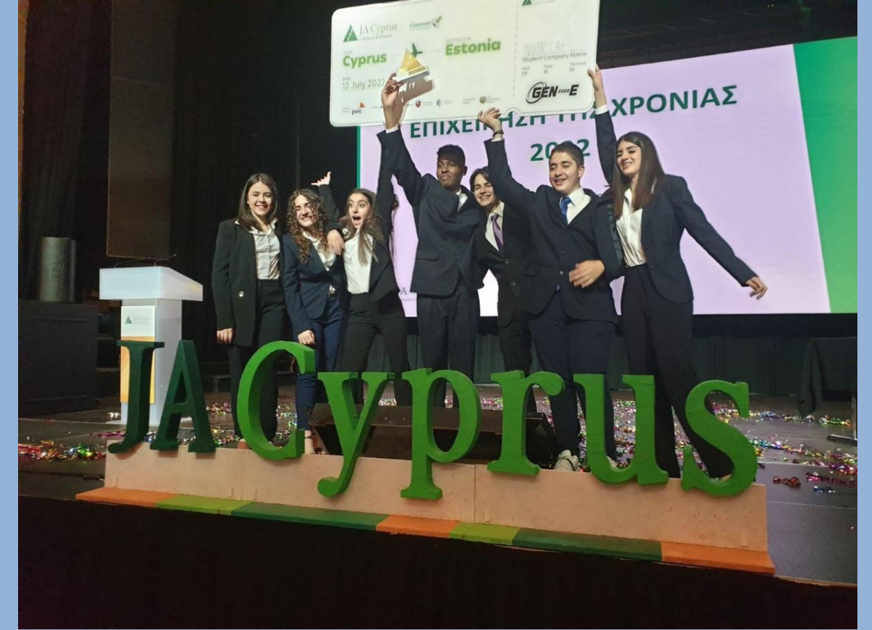
Α' Βραβείο στον διαγωνισμό «Junior Achievement» για την ομάδα του Σχολείου μας Nutrica+