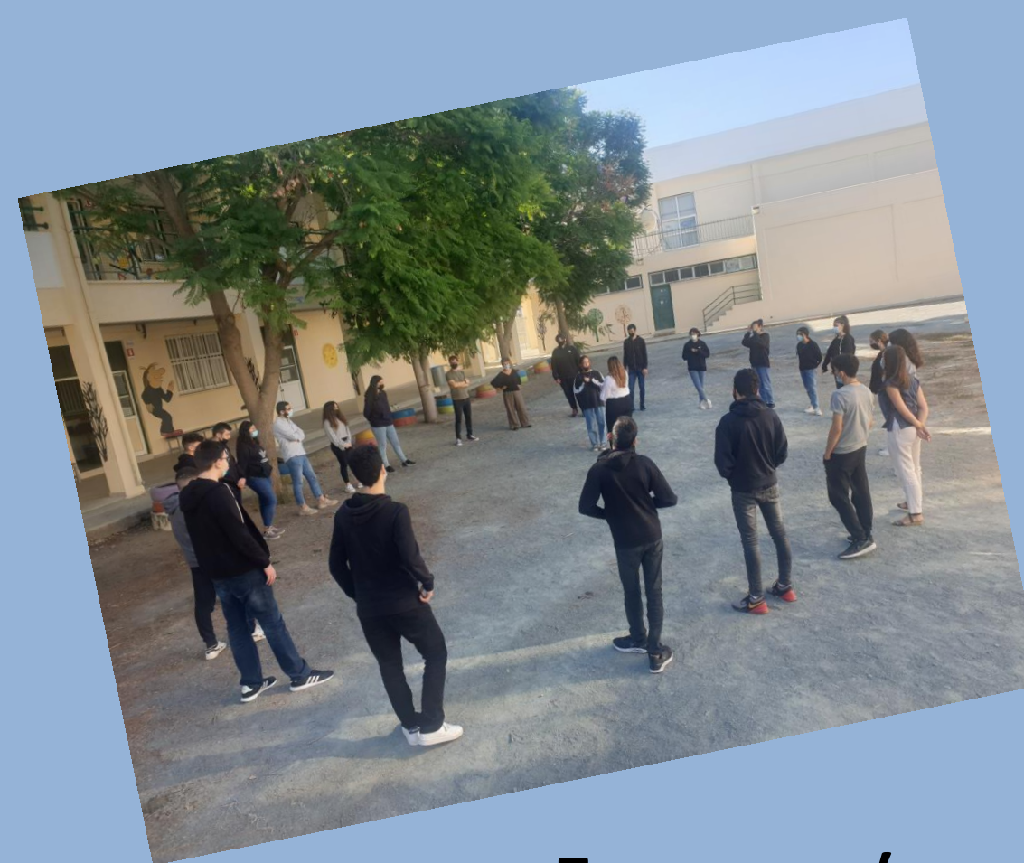
Συμμετοχή στο πρόγραμμα «Young Innovators»