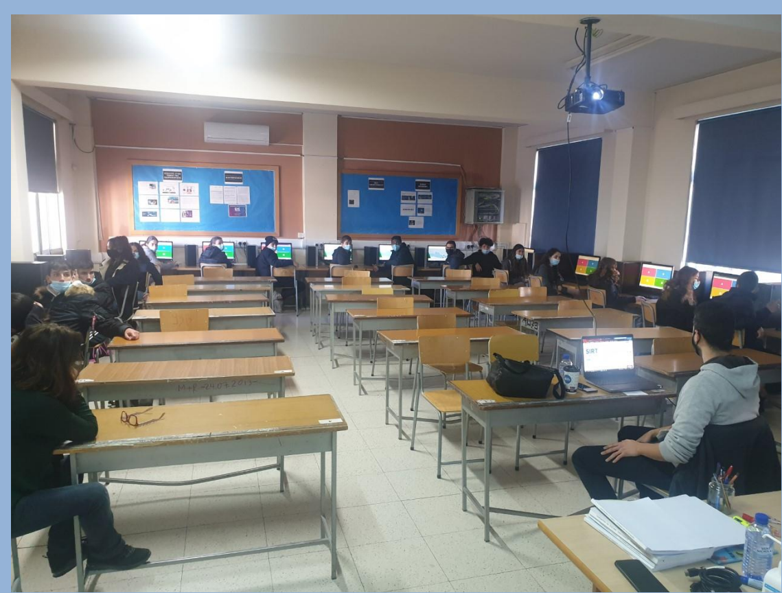
Συμμετοχή στο πρόγραμμα «Μικροί Εκπαιδευτές»