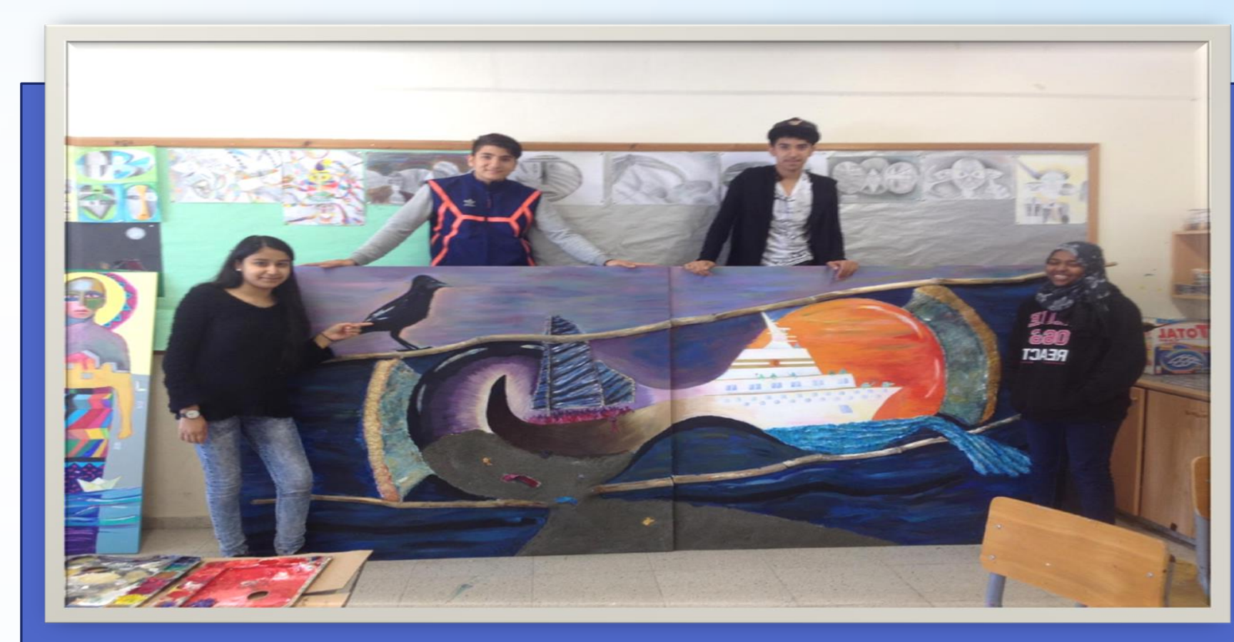
7ος Παγκύπριος διαγωνισμός εικαστικών τεχνών με θέμα: Ταξίδι, διαδρομή