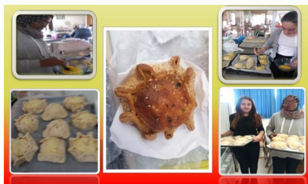
Ζύμωμα φλαούνων από τα παιδιά με μεταναστευτική βιογραφία