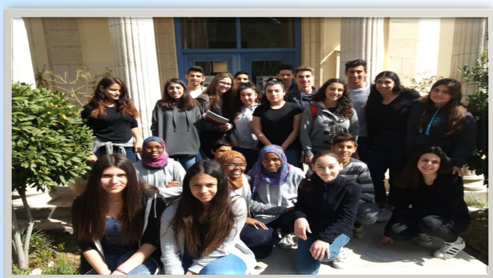
Συμμετοχή στον Διεθνή Διαγωνισμό Ποίησης Castello di Duino

➤ Μείωση ρατσιστικών περιστατικών (π.χ. στερεοτυπικές εκφράσεις για επίπεδα μάθησης, κοινωνική και εθνική προέλευση κλπ)