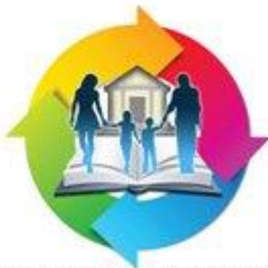
ΣΕΜΙΝΑΡΙΑ ΣΕ ΣΧΟΛΙΚΗ ΒΑΣΗ ΚΑΙ ΓΟΝΕΙΣ