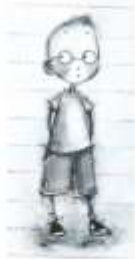
Νιώθω άβρατος όταν