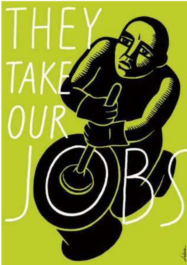
Διεθνής έκθεση αφισών «30 αφίσες για τη Μετανάστευση», gsociety.wordpress.com

3. Να μελετήσετε την πιο κάτω αφίσα και να κάνετε τις εργασίες που ακολουθούν.