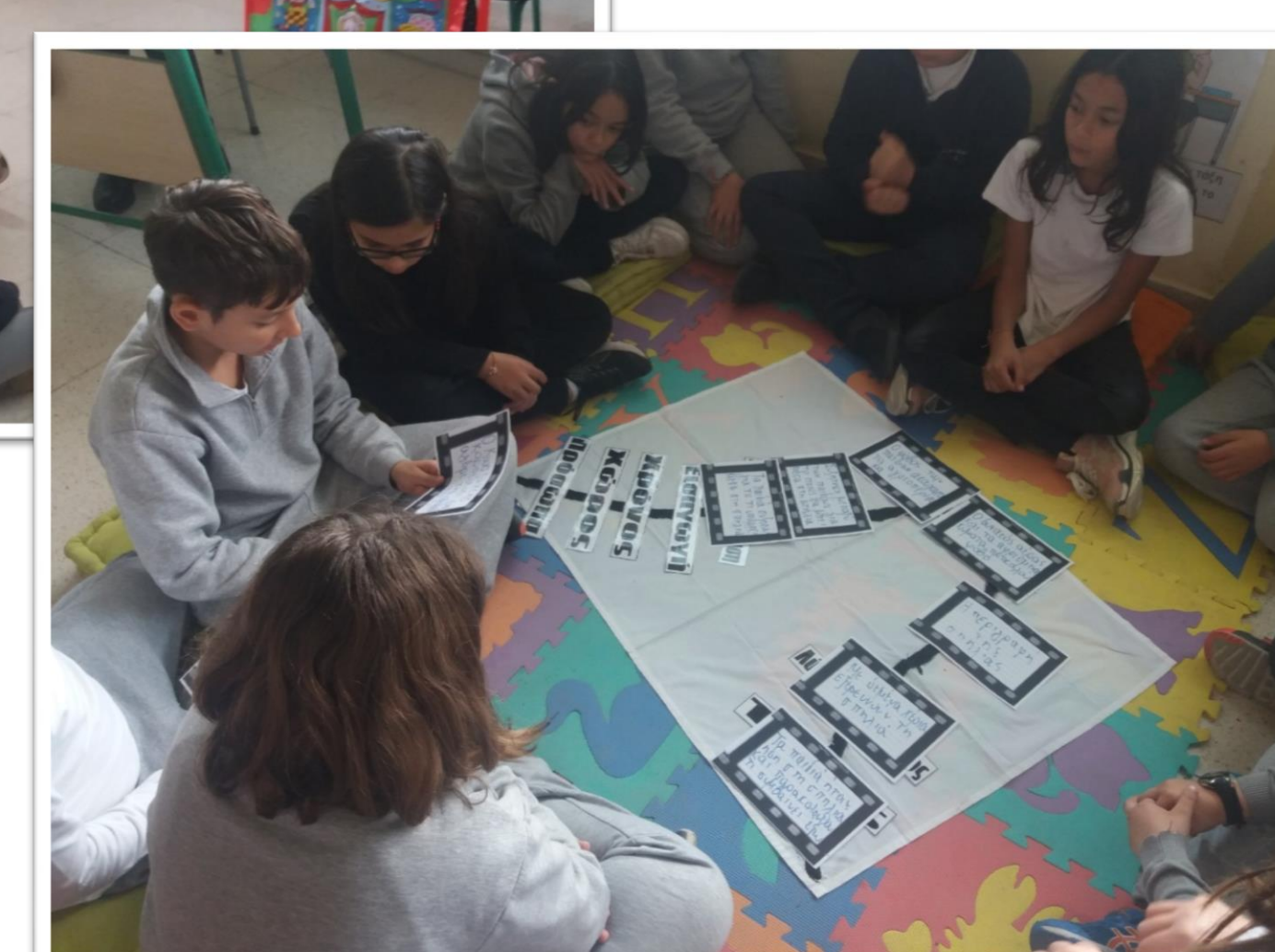
Χωρισμός κειμένου σε επεισόδια