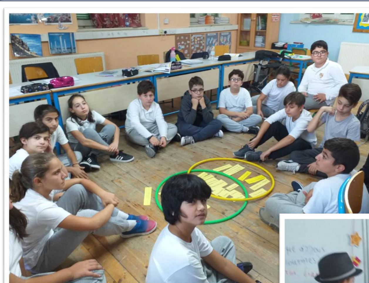
Σύγκριση κειμένων στην ολομέλεια