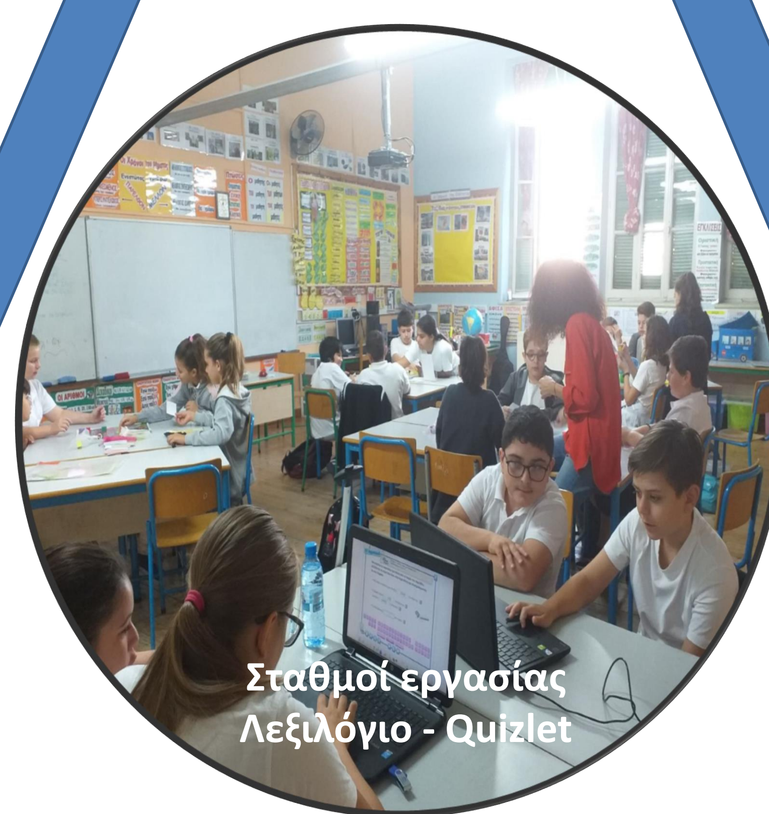
Σταθμοί εργασίας Λεξιλόγιο - Quizlet