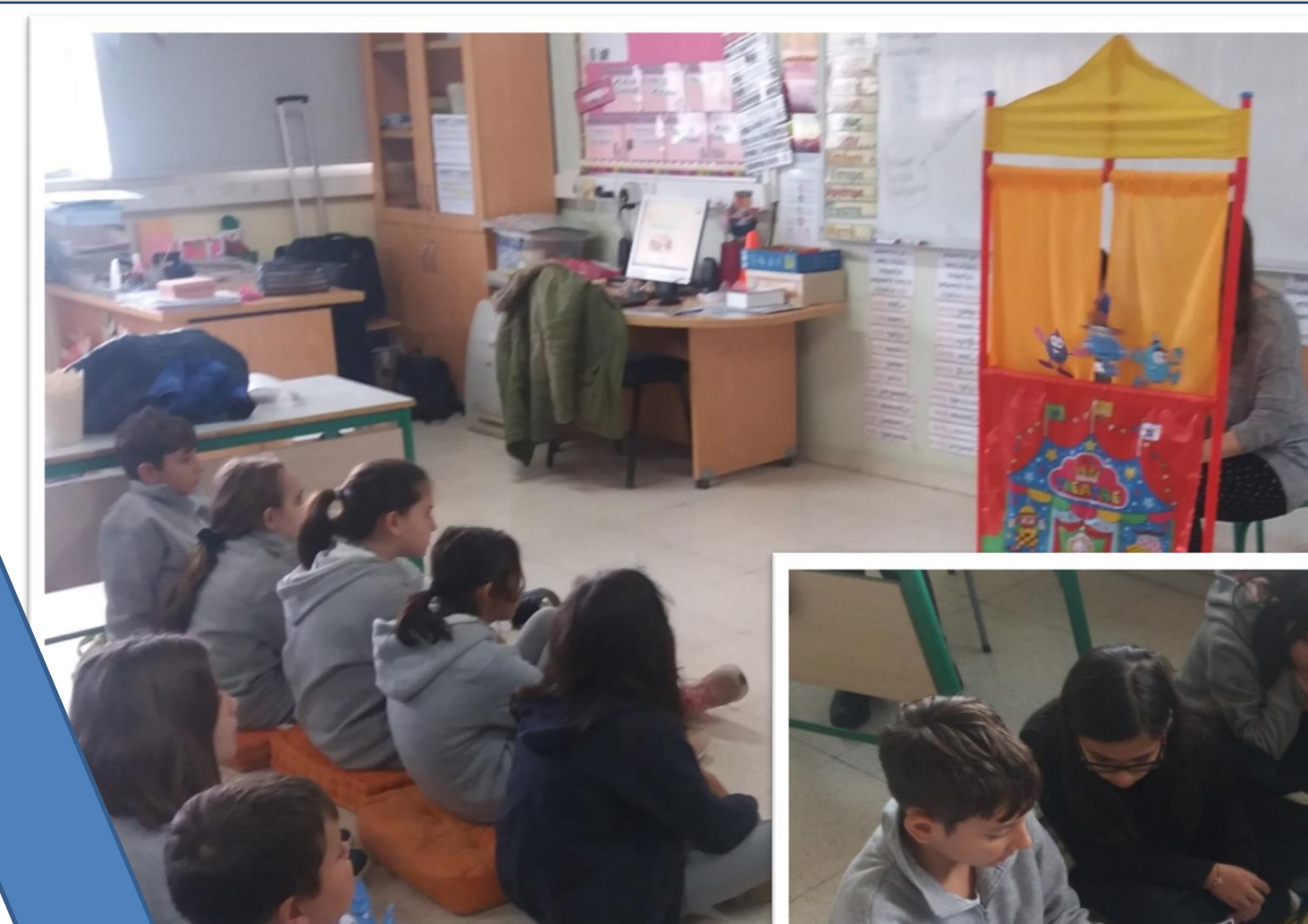
Κουκλοθέατρο - Παραγωγή προφορικού λόγου