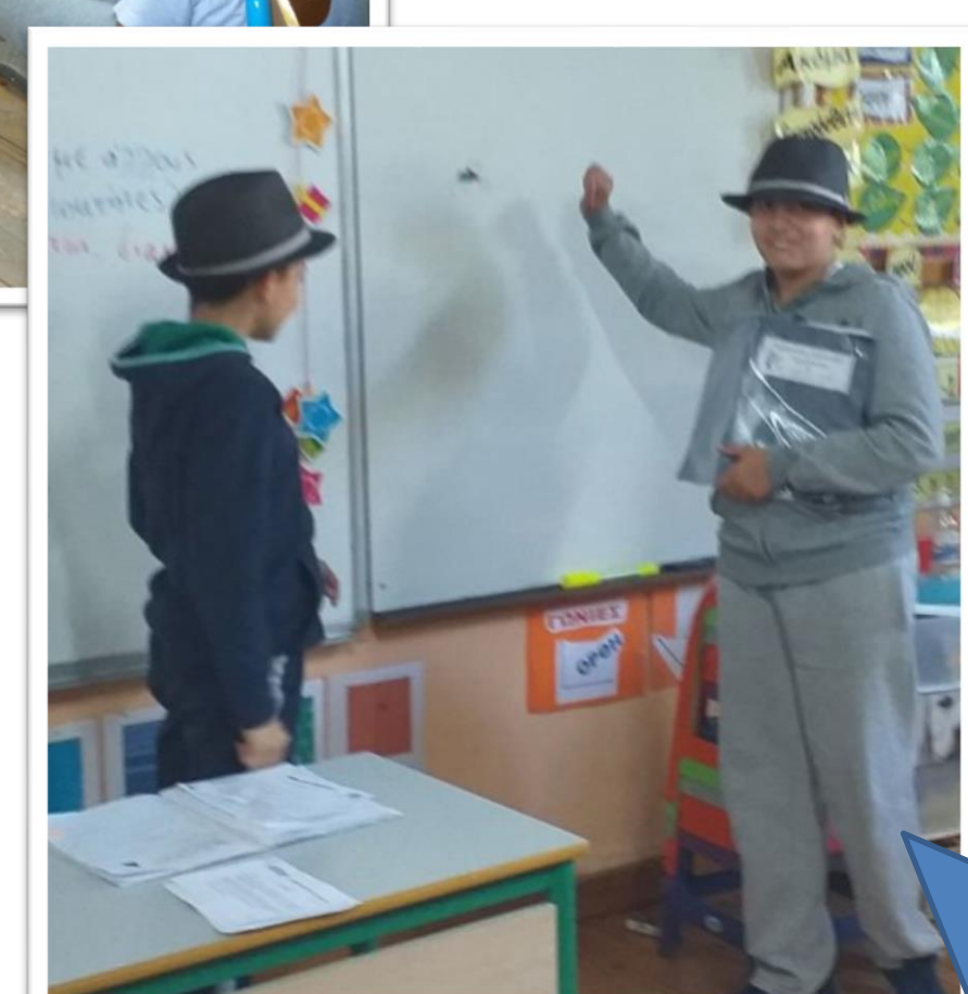
Υπόδυση ρόλων - παραγωγή προφορικού λόγου