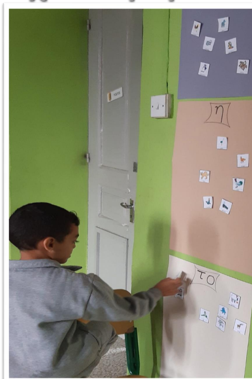
«Πινακίδες 3 Γέννη» - ταξινόμηση θεματικού λεξιλογίου ανά γένος