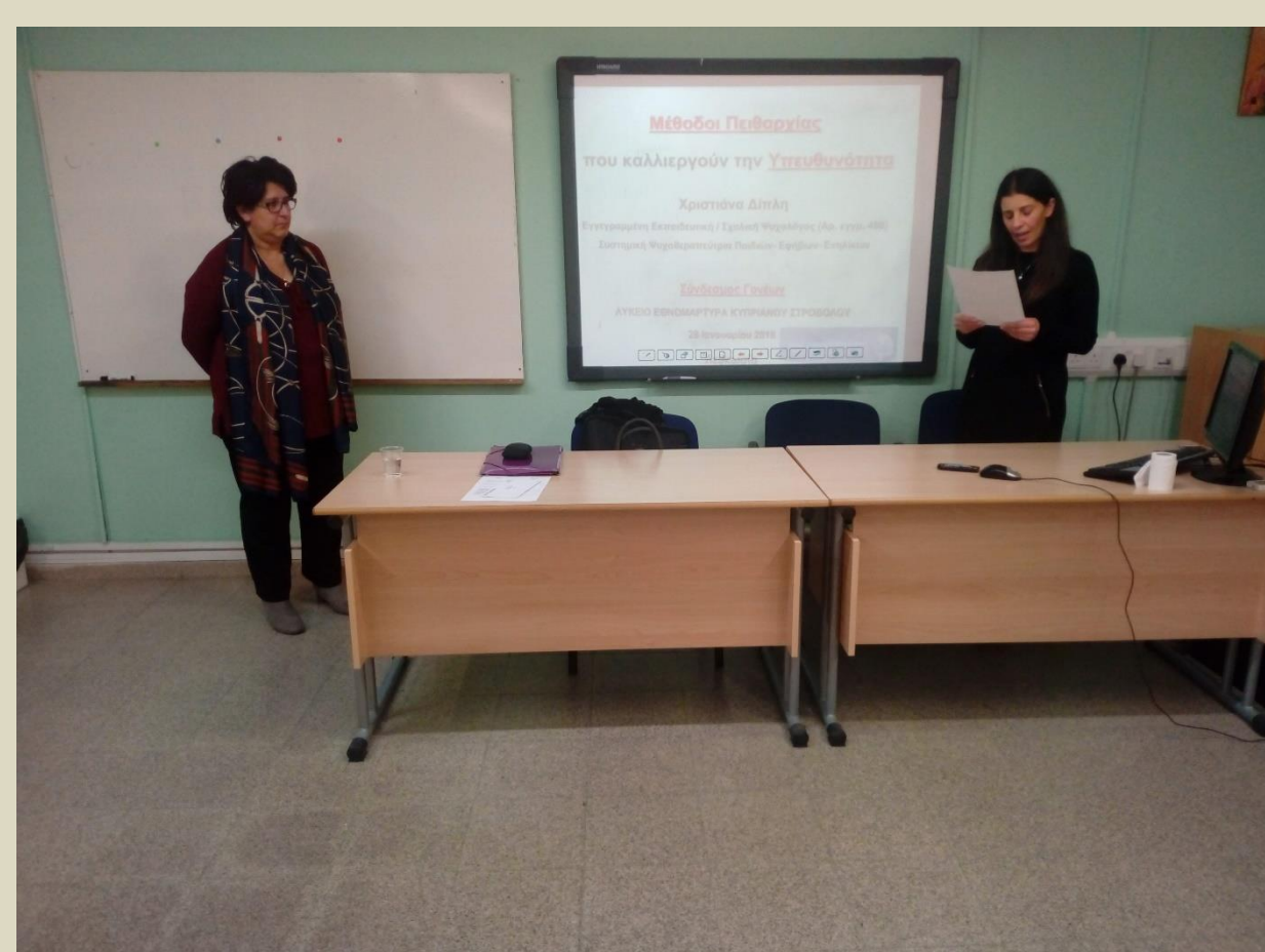
Σεμινάριο για γονείς (Χρ. Δίπλη) με τη συμμετοχή εκπαιδευτικών