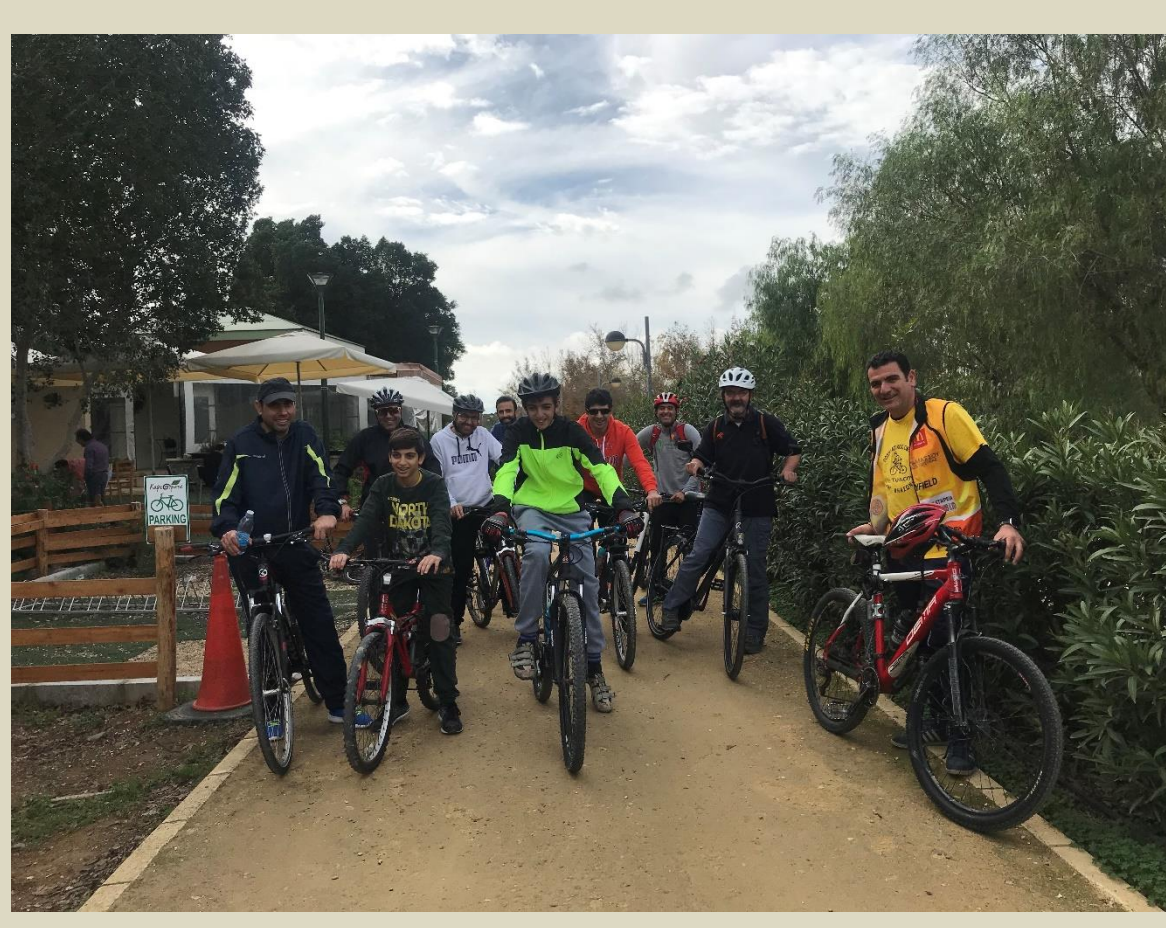
Οργάνωση ποδηλατικής βόλτας από κοινού εκπαιδευτικών-γονιών-μαθητών/μαθητριών