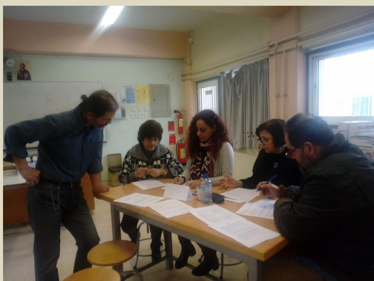
Ημέρα Εκπαιδευτικού: Προώθηση της Συνεργατικής Μάθησης μέσω του μαθήματος της Φυσικής (διαφοροποιημένη διδασκαλία στους εκπαιδευτικούς από τον Διευθυντή)