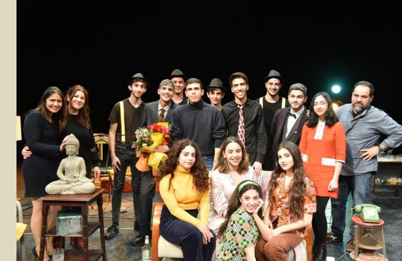
Θεατρική παράσταση (συνεργασία εκπαιδευτικών-γονιών-μαθητών/μαθητριών)