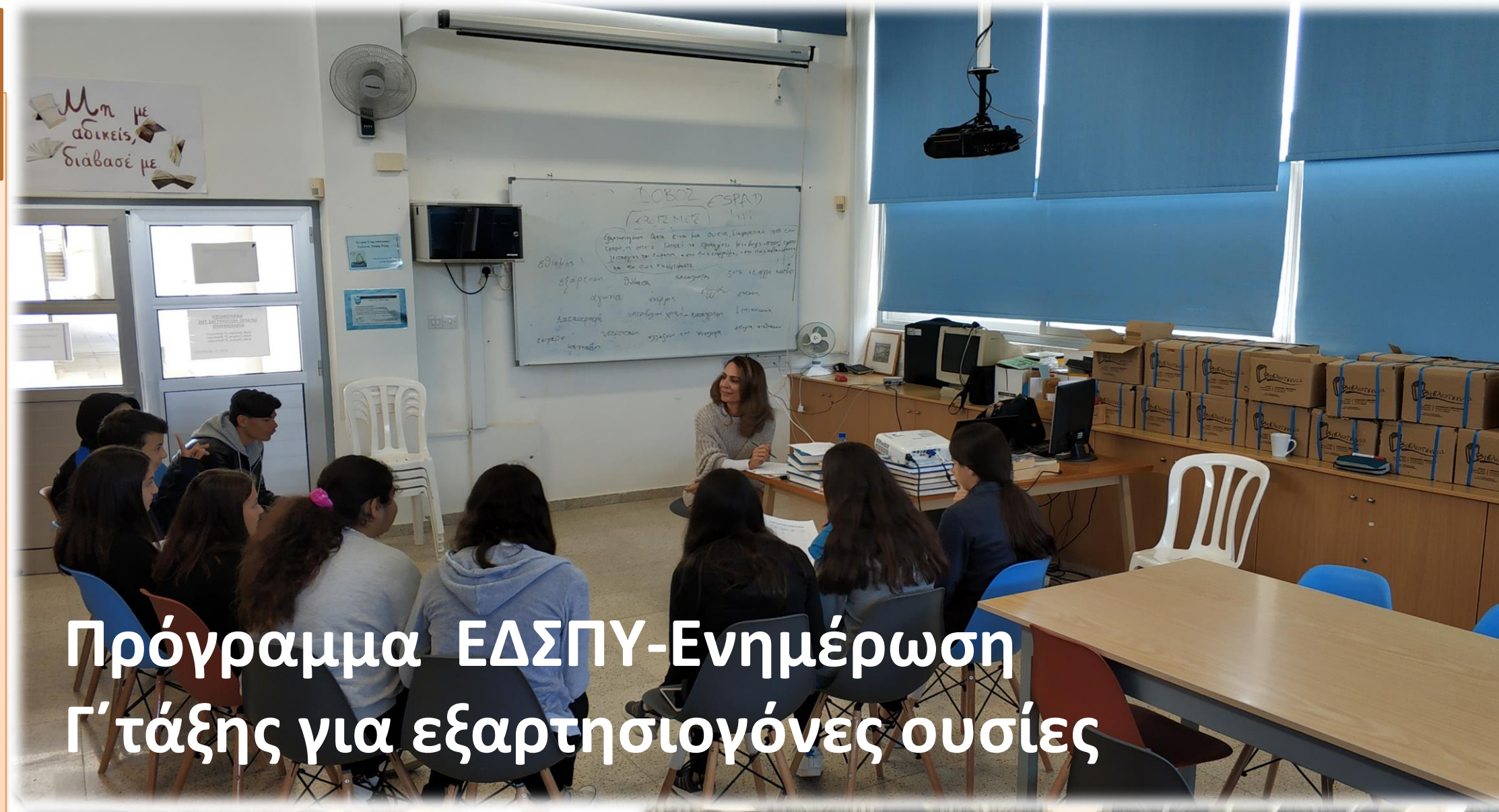
Πρόγραμμα ΕΔΣΠΥ-Ενημέρωση Γ' τάξης για εξαρτησιογόνες ουσίες