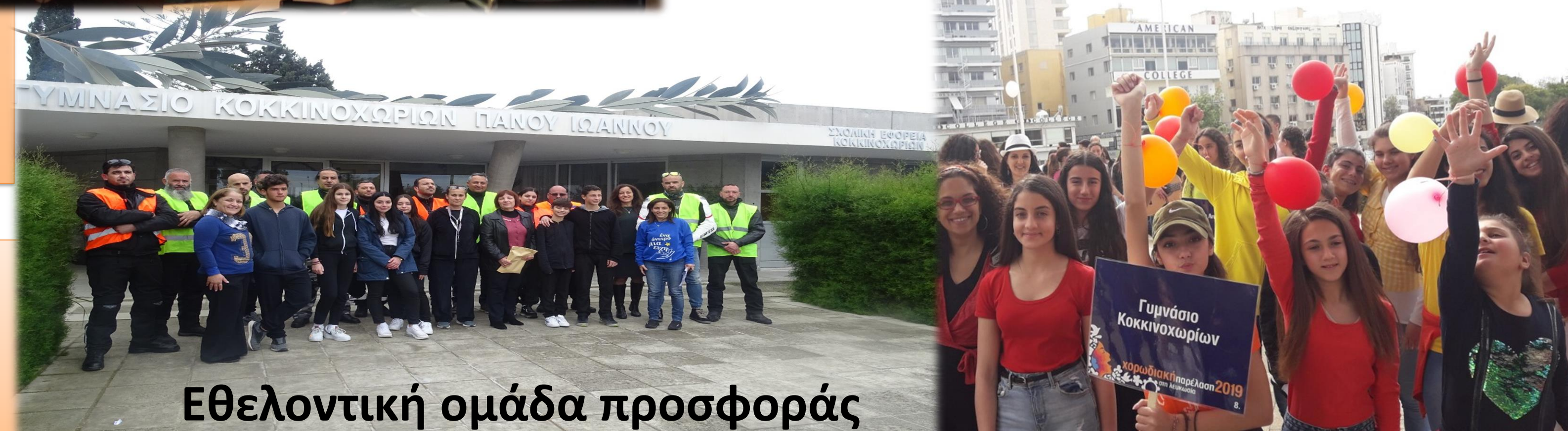
Εθελοντική ομάδα προσφοράς