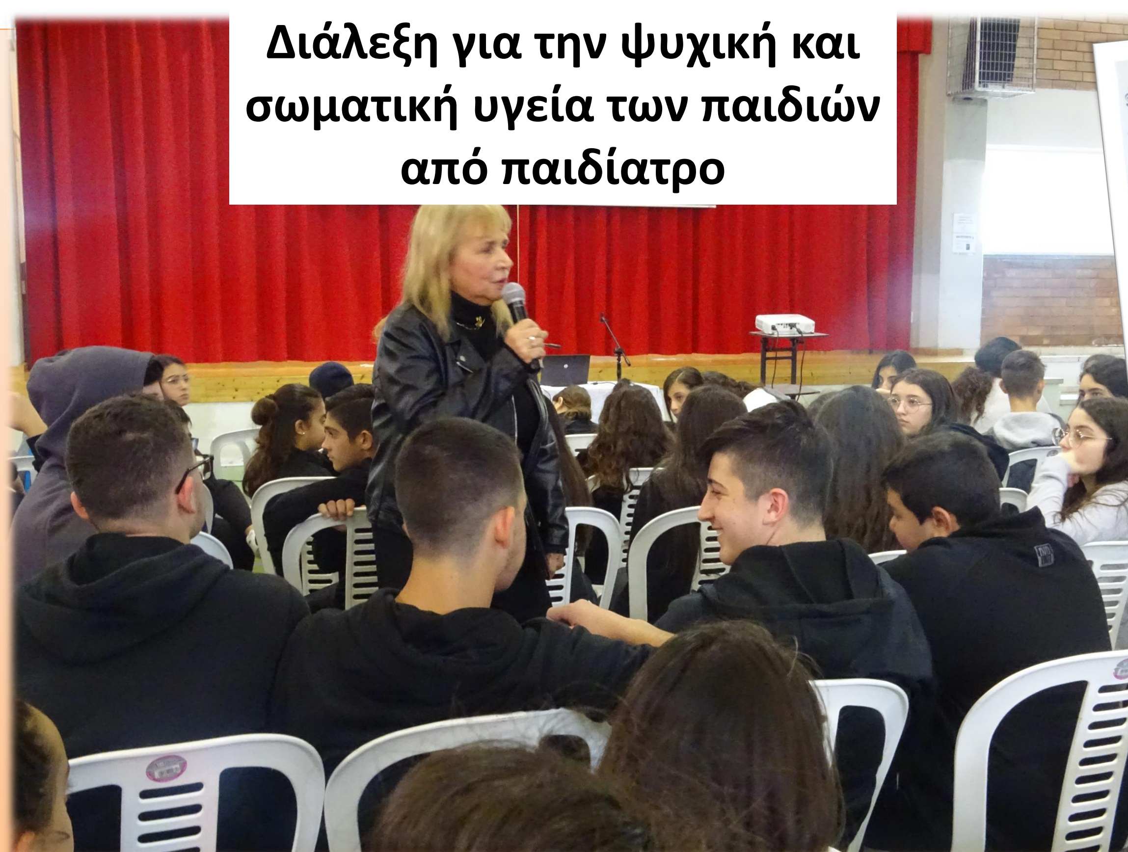
Διάλεξη για την ψυχική και σωματική υγεία των παιδιών από παιδίατρο