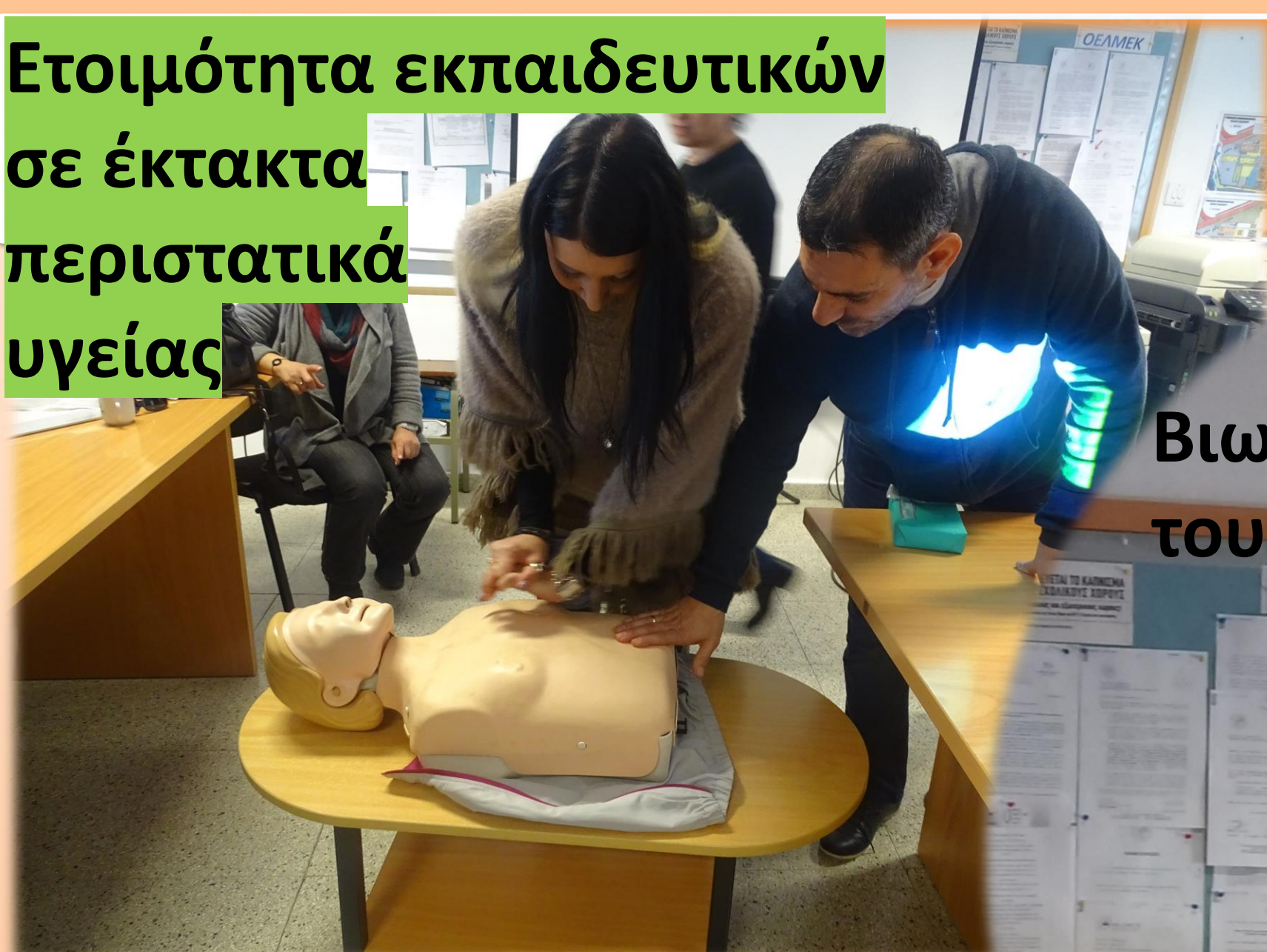
Βιωματικό εργαστήριο με τους/τις εκπαιδευτικούς

Ετοιμότητα εκπαιδευτικών σε έκτακτα περιστατικά υγείας