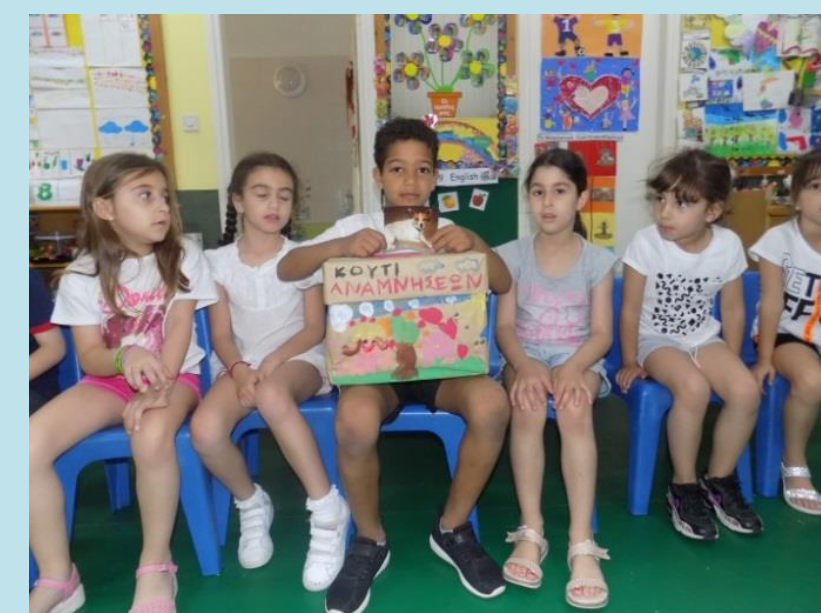
Διασύνδεση με Τομέα Προσωπικής και Κοινωνικής Συνειδητοποίησης