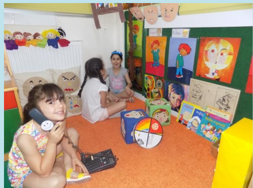
Δημιουργία Κέντρου Μάθησης «Συναισθημάτων»