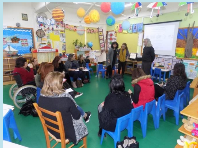
Σεμινάριο «Εναλλακτικοί τρόποι διδασκαλίας»