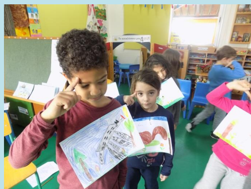
Θεατρικές Συμβάσεις Υπόδυση Ρόλων