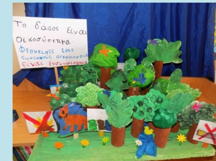
Διασύνδεση με Περιβαλλοντική Εκπαίδευση