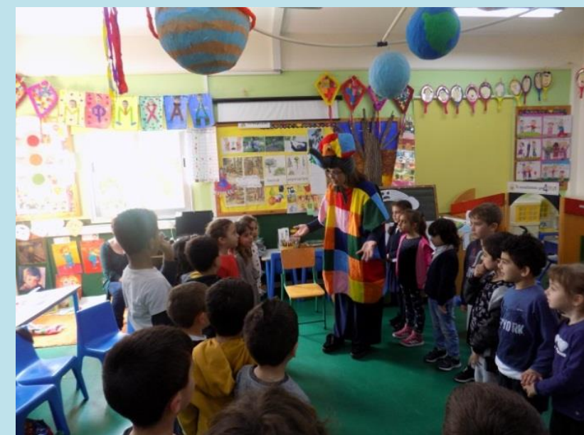
Θεατρικές Συμβάσεις Διάδρομος Σκέψης