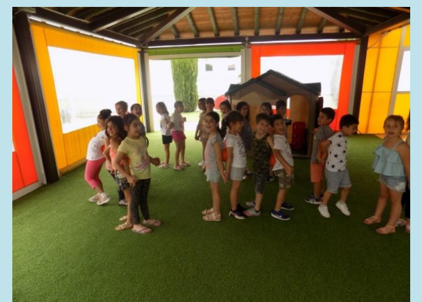
Παιχνίδια Συνεργασίας – Εμπιστοσύνης