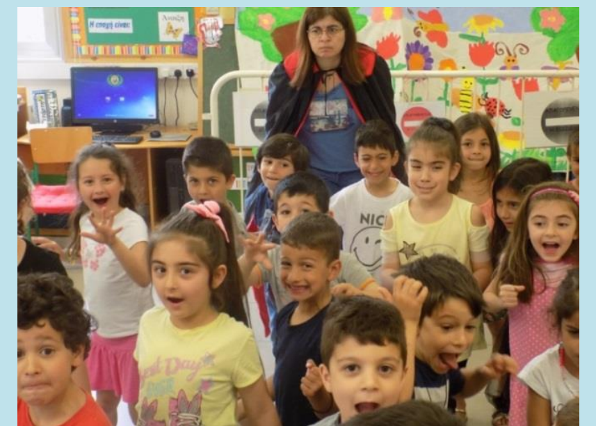
Ο Εγωιστής Γίγαντας Αλλιώς...