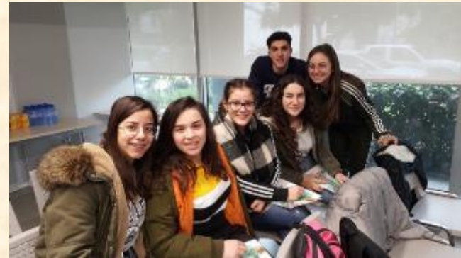
Επίσκεψη στο Τιμεντοποιείο Βασιλικού