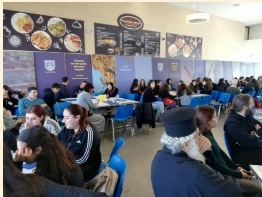
Η Ημερίδα που διοργάνωσε η Ιερά Μητρόπολη με τον τίτλο «Εφηβεία: ένα όμορφο αλλά όχι εύκολο ταξίδι προς την ενηλικίωση».