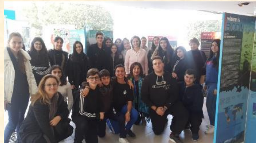
Επιστημονική έκθεση με θέμα «Η Βιοποικιλότητα είναι ζωή, είναι η ζωή μας» στο Γαλλικό Μορφωτικό Ινστιτούτο Κύπρου.