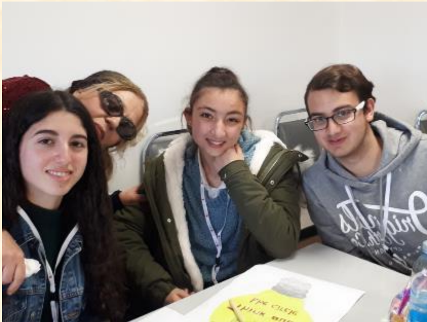
Ημερίδα και τον Διαγωνισμό «Μπες στα παπούτσια του Μάρκετινγκ για μια μέρα», που έγινε στο Πανεπιστήμιο Λευκωσίας.