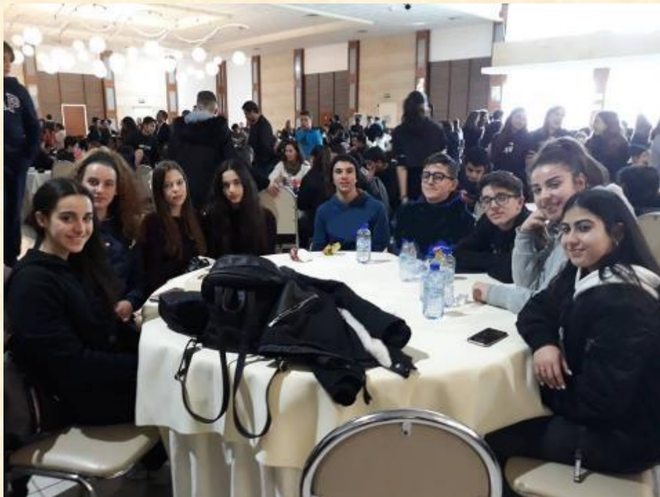
Μαθηματική Σκυταλοδρομία», που διοργανώθηκε από την Κυπριακή Μαθηματική Εταιρεία (ΚΥΜΕ), την 1η Φεβρουαρίου 2019.