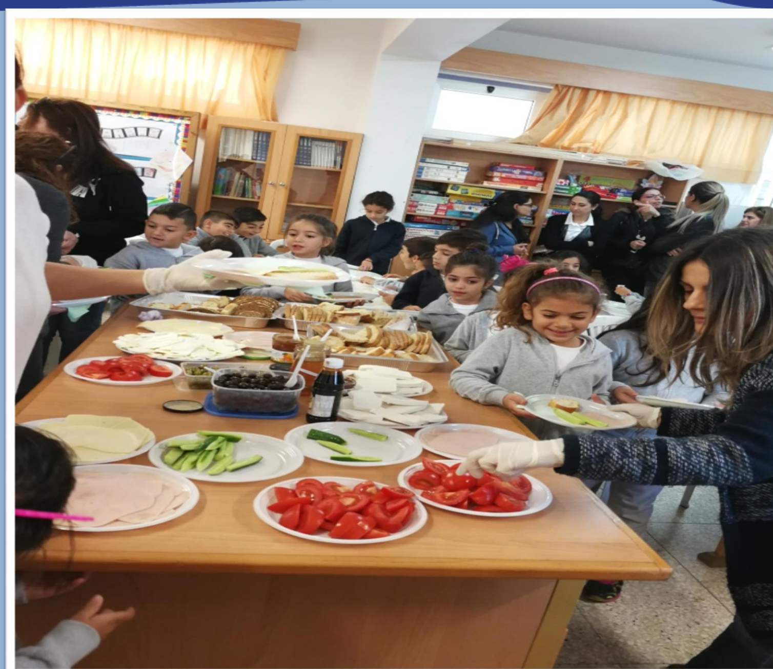
Διοργάνωση εκδήλωσης για την υγιεινή διατροφή και την σωστή άσκηση κατά την οποία ετοιμάστηκε πρόγευμα με τη συμβολή των γονέων.