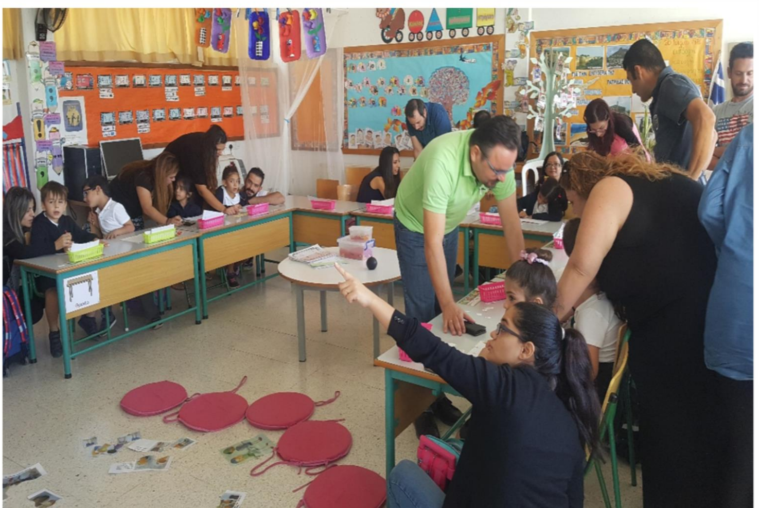
Εμπλουτισμός των μαθημάτων με παιγνιώδεις δραστηριότητες για τη βελτίωση του προφορικού λόγου με τη συμμετοχή των γονέων.