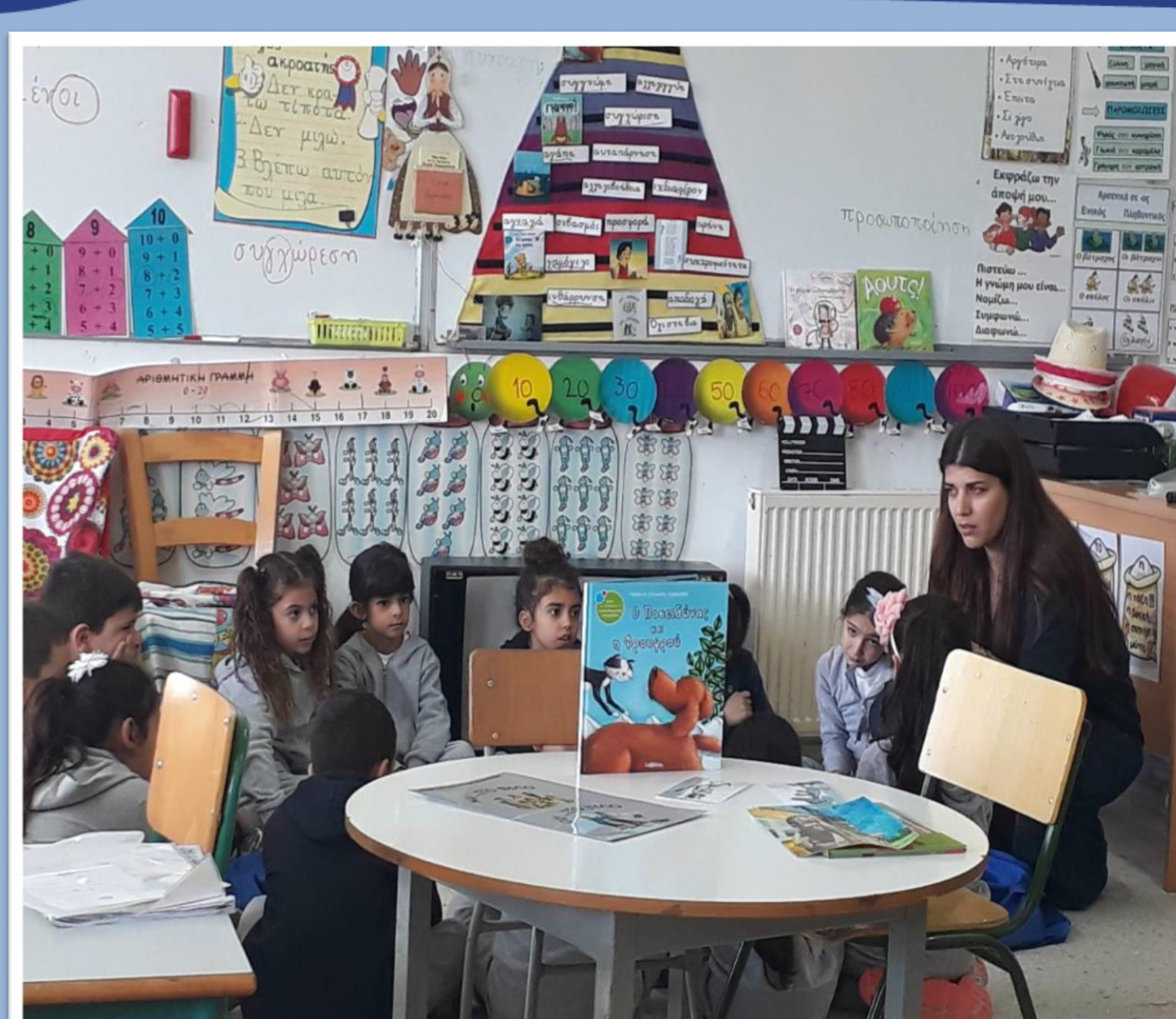
Η καλλιέργεια της φιλιανγνωσίας με σκοπό τον εμπλουτισμό του λεξιλογίου των μαθητών.