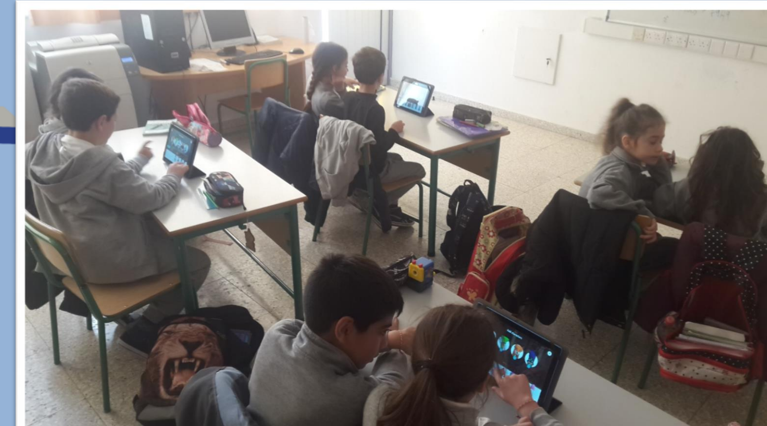
Αξιοποίηση της τεχνολογίας για τη δημιουργία και την ηχογράφηση παραμυθιών.