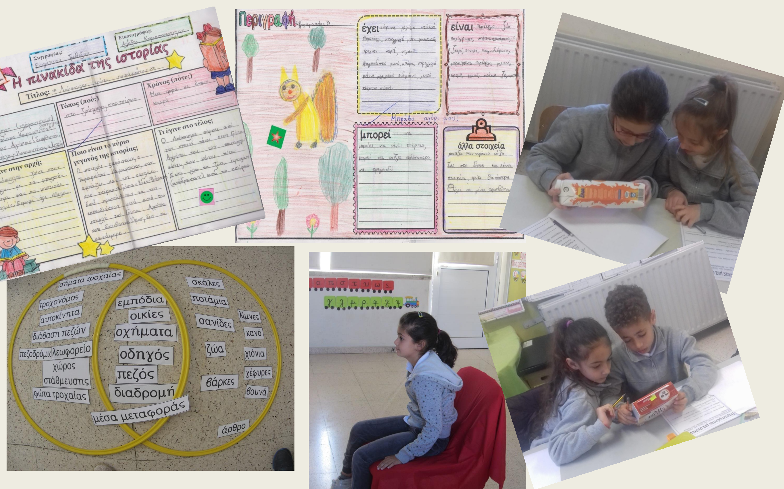
ΕΠΕΞΕΡΓΑΣΙΑ ΚΕΙΜΕΝΩΝ - ΕΡΓΑΛΕΙΑ