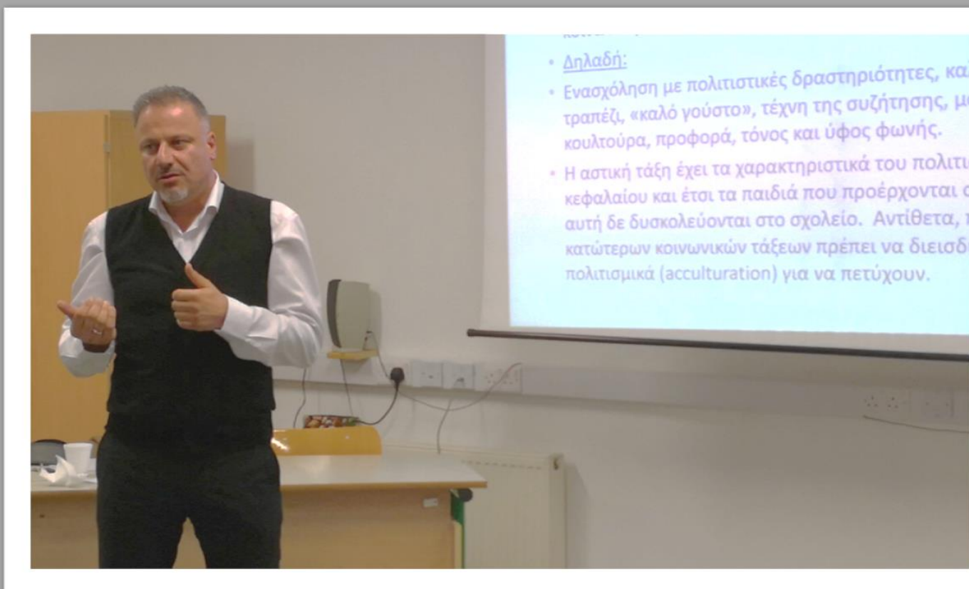
Διαλέξεις προς γονείς και εκπαιδευτικούς