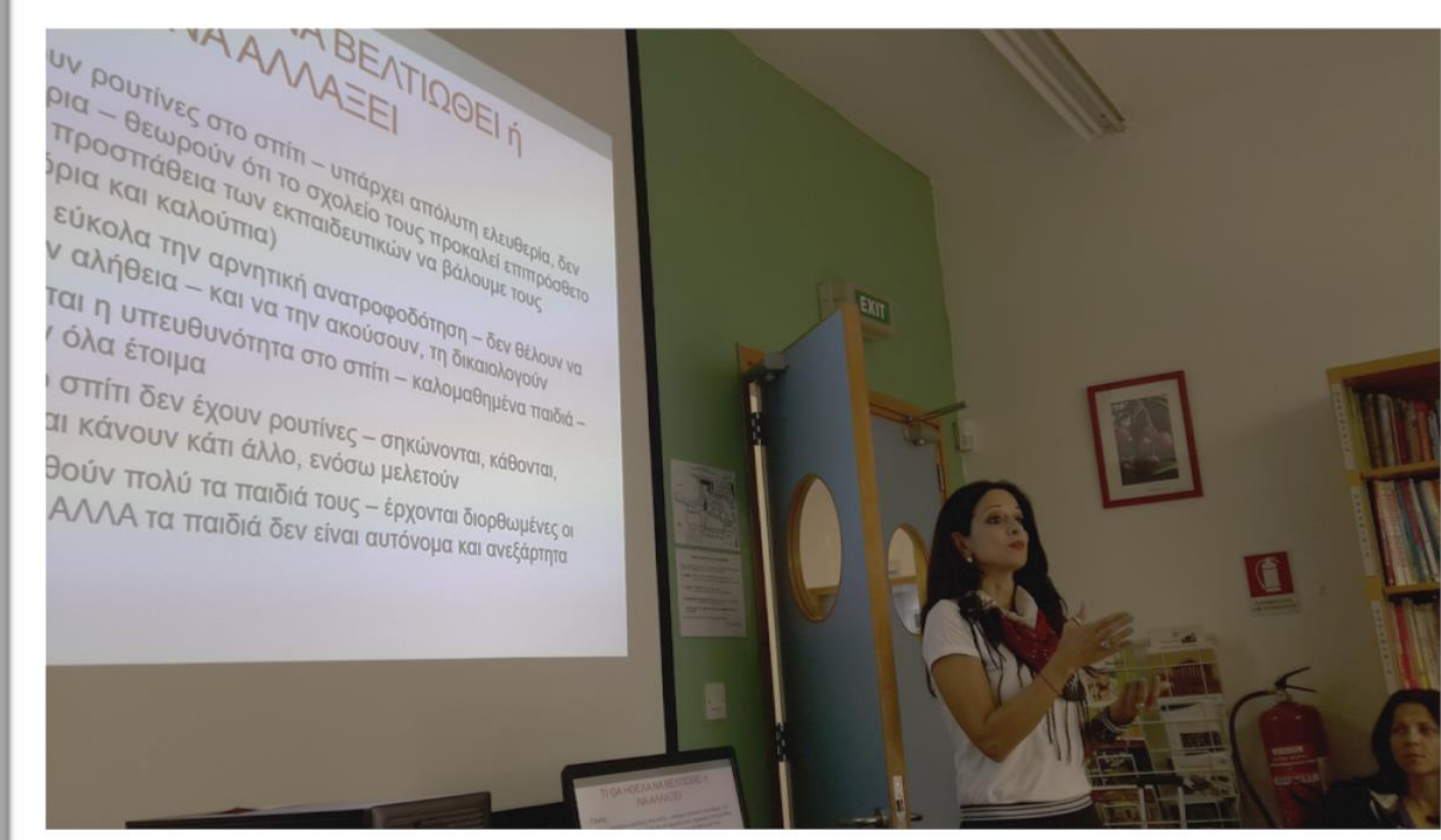
Συνεδρίες- Επιμόρφωση Προσωπικού