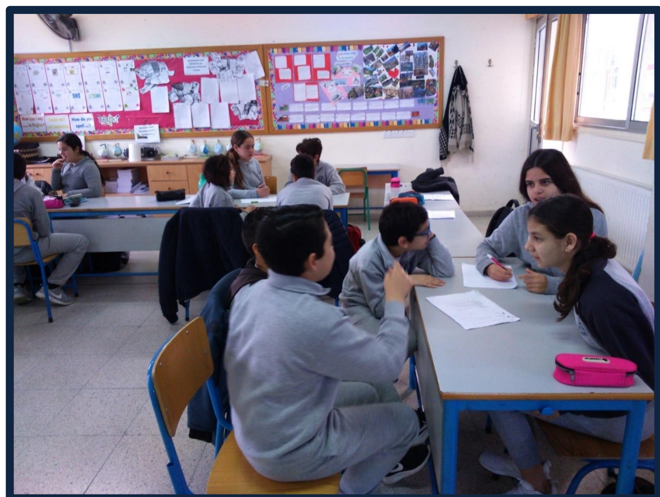
Δύο τμήματα γράφουν διήγημα: «Φίλοι μετ' εμποδίων»