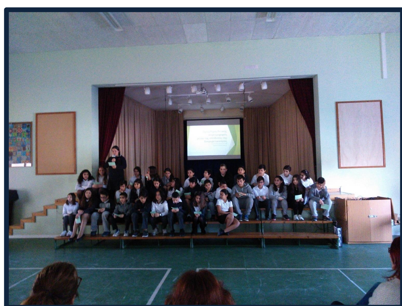
Παρουσίαση απόψεων μαθητών/τριών προς τους γονείς και την επιθεωρήτρια