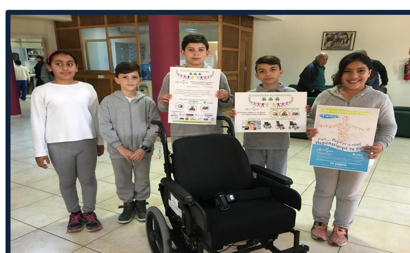
Παράδοση τροχοκαθίσματος. Όλοι μαζί μπορούμε!