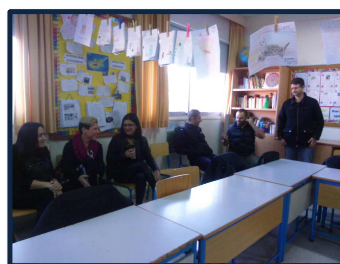
Οι γονείς γίνονται μαθητές