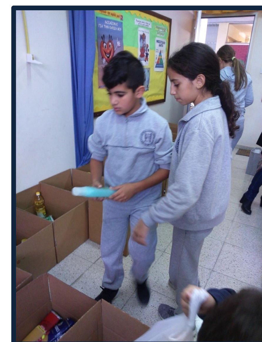
Ετοιμασία πακέτων αγάπης