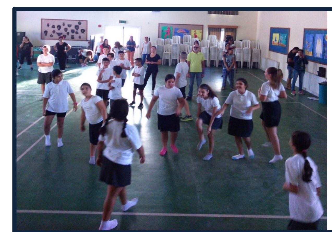
Πρωινή γυμναστική: παιδιά-γονείς-εκπαιδευτικοί

Απόψεις μαθητών για την Υ.Ε.Μ. «Αυτό το πρόγραμμα μας βοηθά να μάθουμε καλύτερα τον εαυτό μας και να σεβόμαστε τους άλλους» «Αν όλοι συγχωρούμε και βοηθούμε τους συνανθρώπους μας, θα έχουμε μια ευτυχισμένη ζωή» «Πλέον συνεργαζόμαστε και ακούμε τις απόψεις ο ένας του άλλου» «Η συμπεριφορά μου έχει βελτιωθεί. Δεν καυγαδίζω και είμαι ήρεμος» «Με ένα καλημέρα και ένα χαμόγελο, μπορείς να αλλάξεις την ημέρα του άλλου ολοκληρωτικά» «Μάθαμε να σκεφτόμαστε διαφορετικά μέσω της συνεργασίας με άλλα παιδιά»