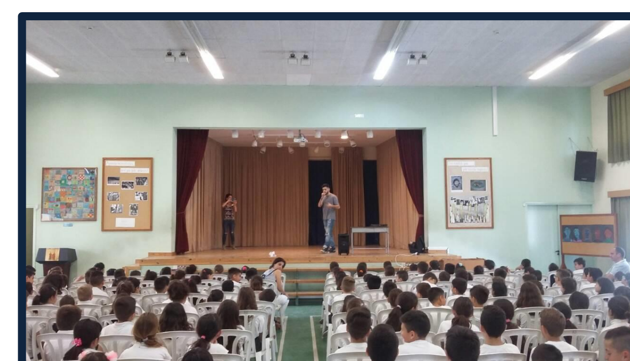
Beatboxing με μαθητές, εκπαιδευτικούς και γονείς