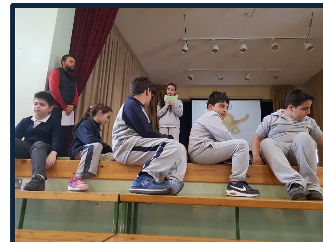
Τα παιδιά της Ειδικής Μονάδας επεξηγούν την εφαρμογή προγράμματος κομπουστοποίησης