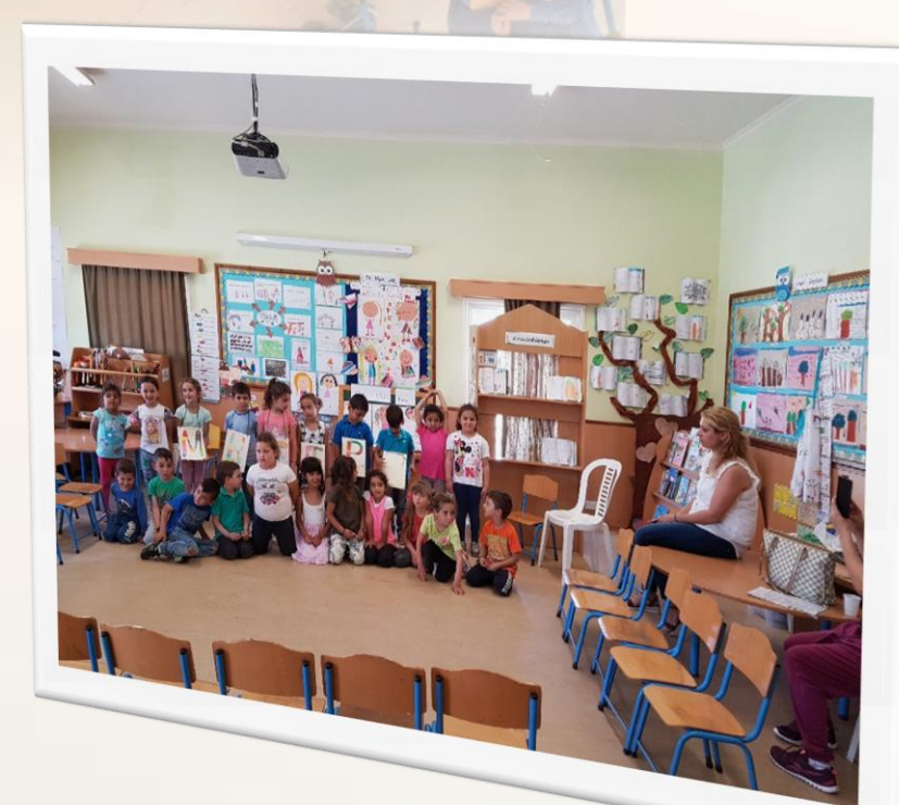
Βοήθεια έχω πρωτάκι