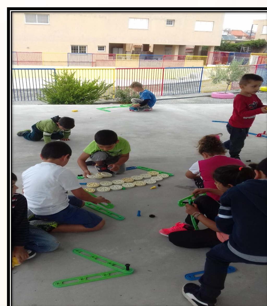
Παιχνίδια στην αυλή