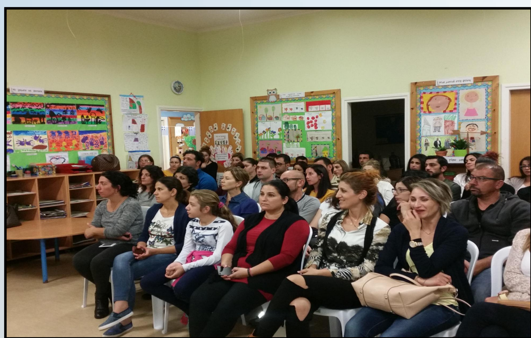
Παρουσίαση γνωριμίας γονιών εκπαιδευτικών