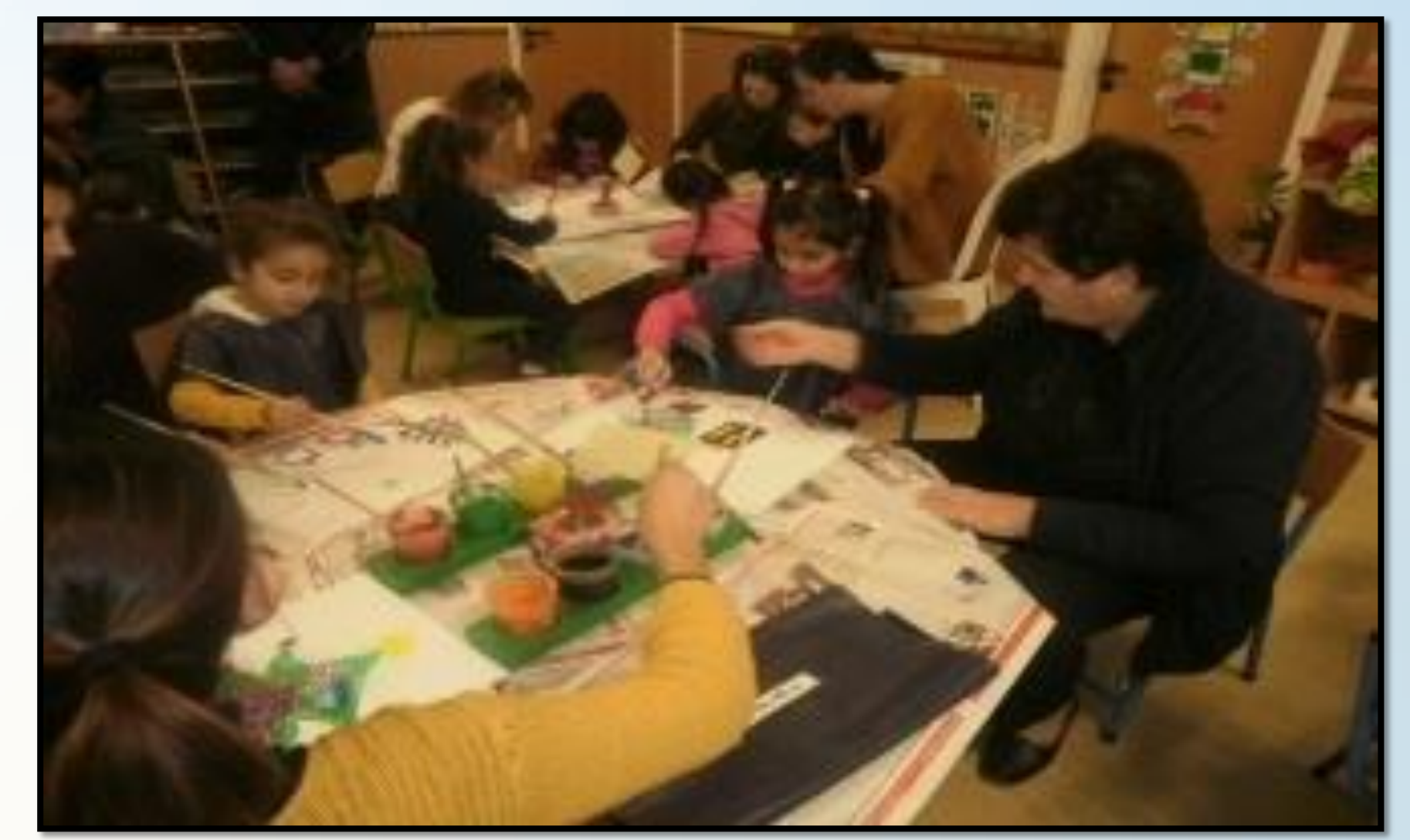
Δειγματικό Μάθημα σε γονείς