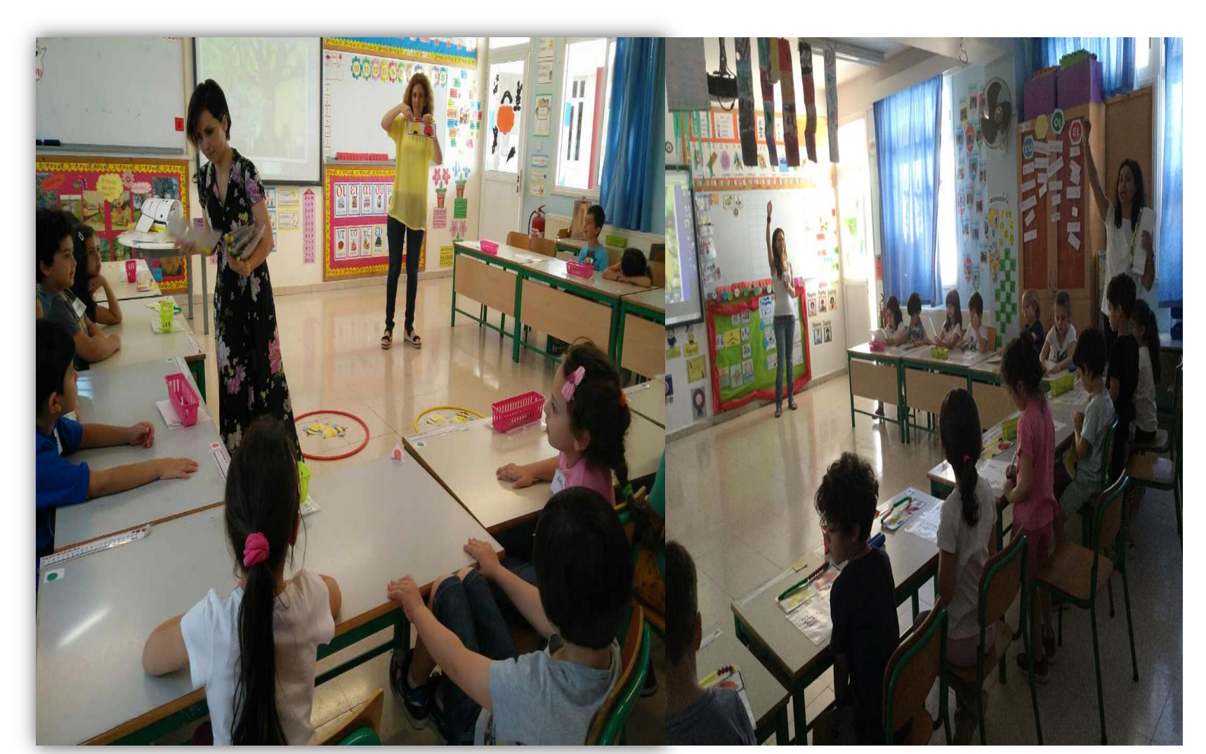
ΣΥΝΔΙΔΑΣΚΑΛΙΑ ΜΕ ΔΑΣΚΑΛΕΣ Α' ΤΑΞΗΣ ΔΗΜΟΤΙΚΟΥ