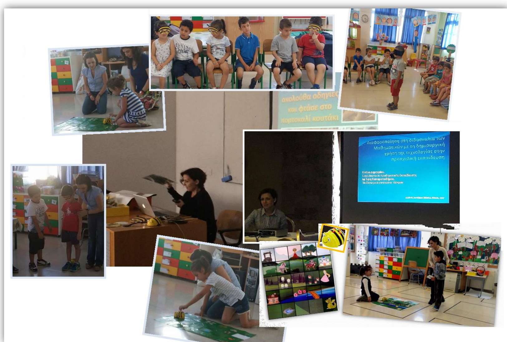
ΕΠΙΜΟΡΦΩΣΗ ΚΑΙ ΣΥΜΜΕΤΟΧΗ σε Προαιρετικό Σεμινάριο του Π.Ι. στο Συνέδριο της Παιδαγωγικής Εταιρείας Κύπρου και στο Διεθνές Συνέδριο για τη Διαφοροποίηση DiDeSu