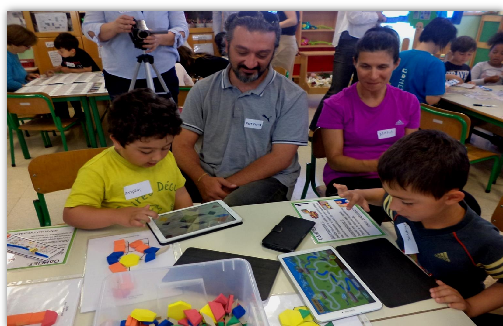
ΕΡΓΑΣΤΗΡΙ ΜΑΘΗΜΑΤΙΚΩΝ ΜΕ ΓΟΝΕΙΣ