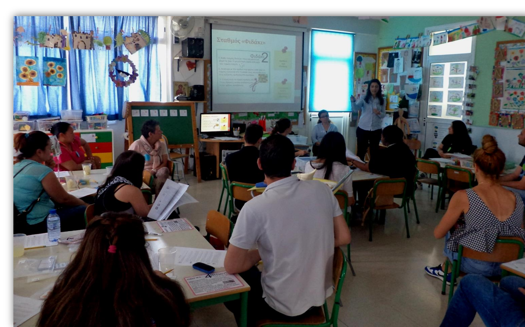
ΕΠΙΜΟΡΦΩΣΗ ΓΟΝΙΩΝ ΤΟΥ ΣΧΟΛΕΙΟΥ