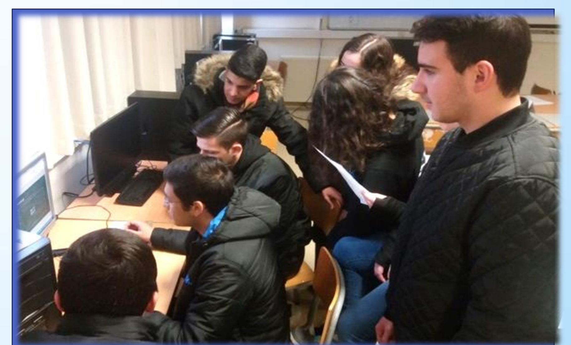
Φωτογραφία από τις δράσεις του Τμήματος Γ1 Θέμα δράσης: Πώς θέλουμε το Σχολείο μας; Διεξαγωγή ερευνητικής εργασίας