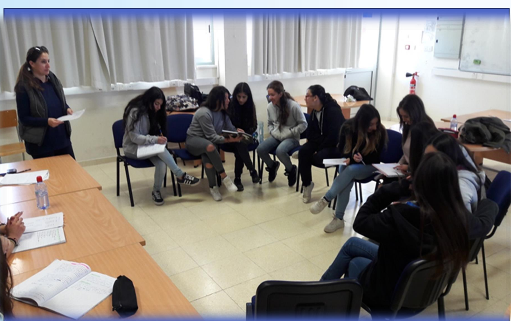
Φωτογραφία από τις δράσεις του Τμήματος Β2 Θέμα δράσης: Βία στην Οικογένεια Συνάντηση με ομάδα ψυχολόγων