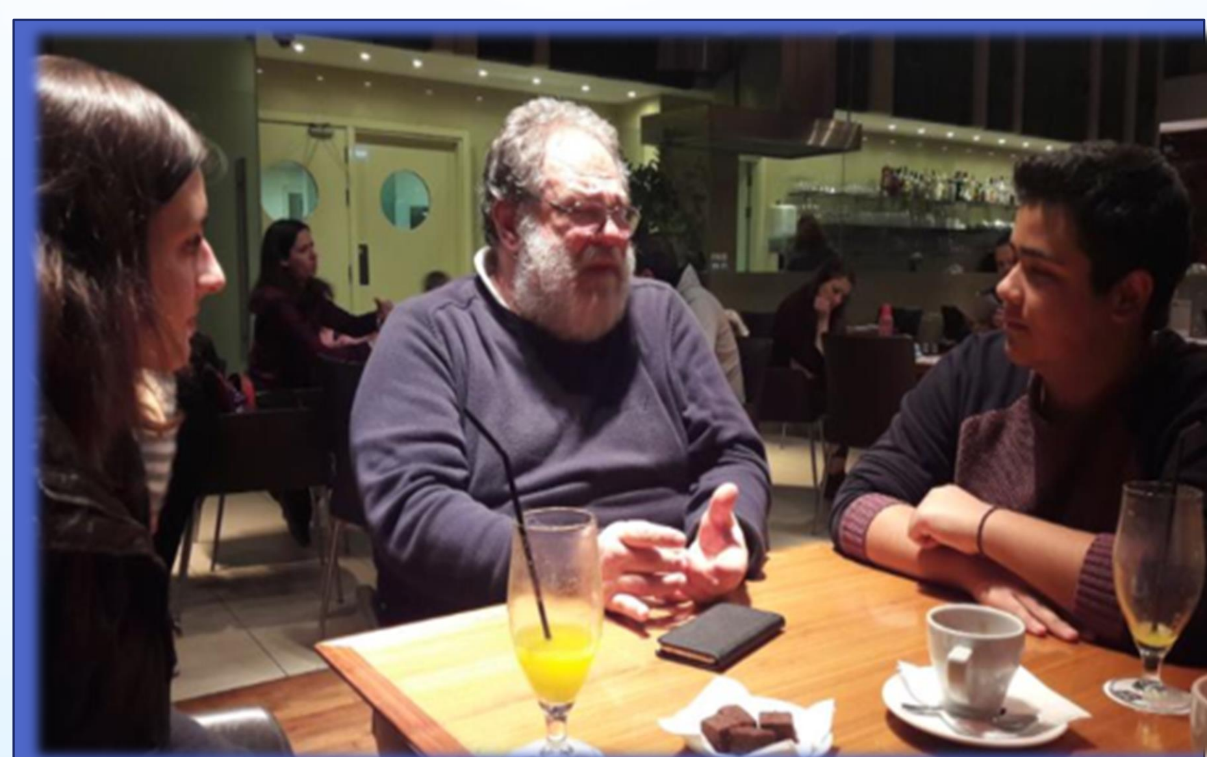
Φωτογραφία από τις δράσεις του Τμήματος Β10 Θέμα δράσης: Διαβάζουμε μαζί με τους γονείς ένα βιβλίο