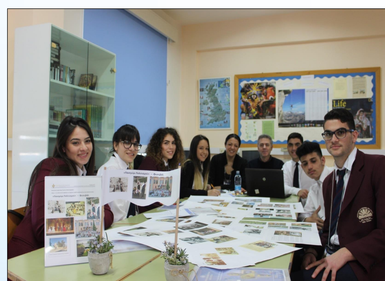
Βιωματικά Εργαστήρια στο πλαίσιο του 13ου Διασχολικού Συνεδρίου