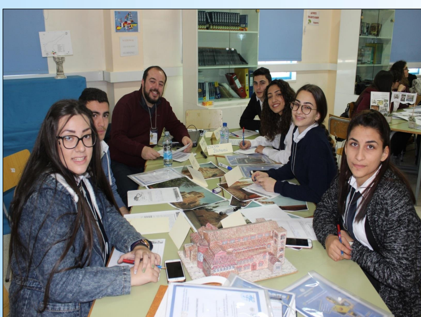
Βιωματικά Εργαστήρια στο πλαίσιο του 13ου Διασχολικού Συνεδρίου