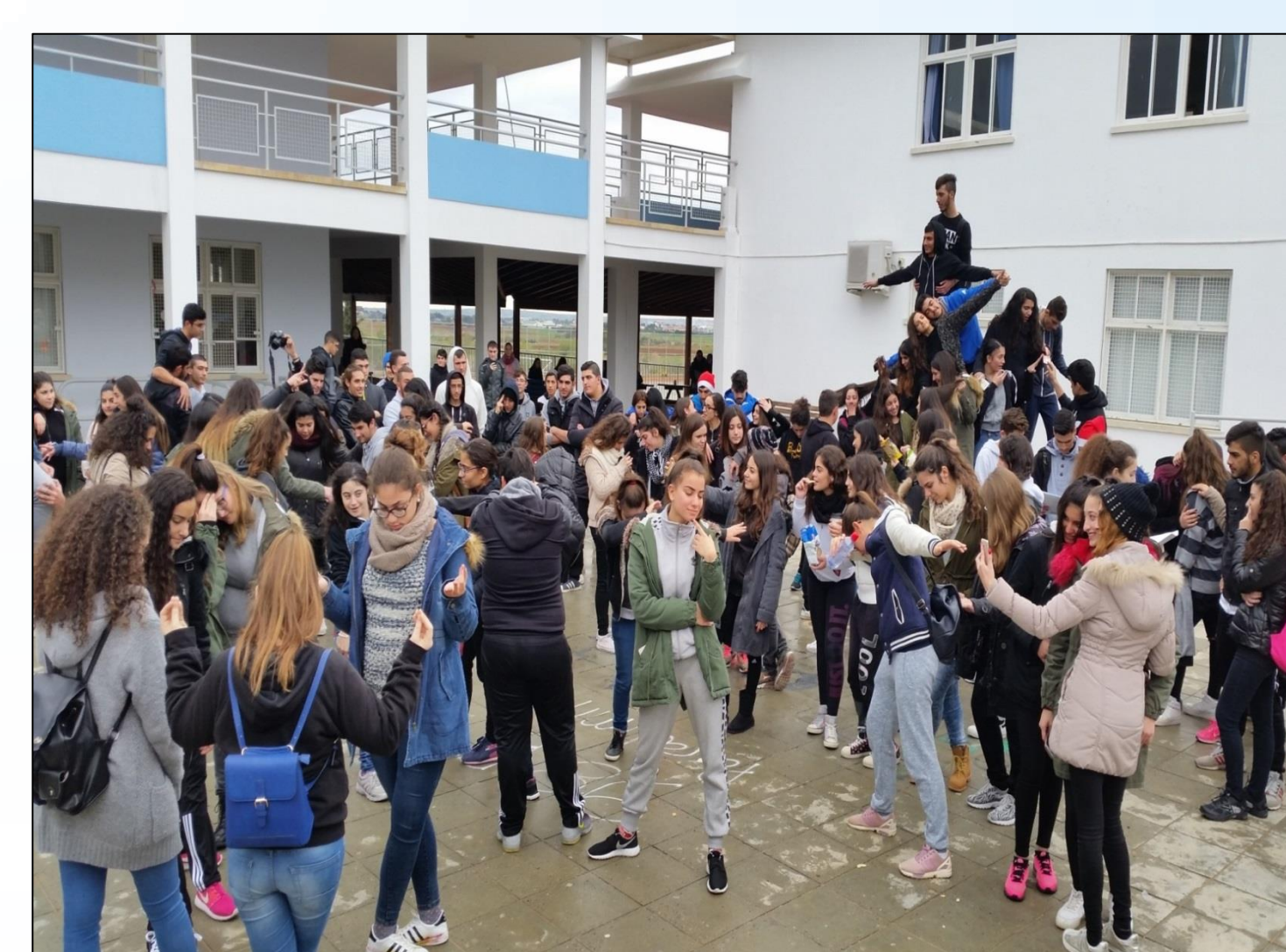
Δραστηριότητες κατά τη διάρκεια των διαλειμμάτων