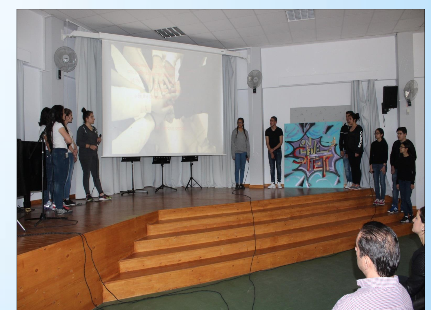
«Μικροί Εκπαιδευτές» Νέες Τεχνολογίες στην Εκπαίδευση