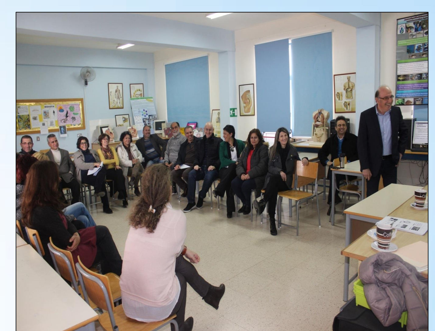
Βιωματικό Εργαστήρι στο σχολείο