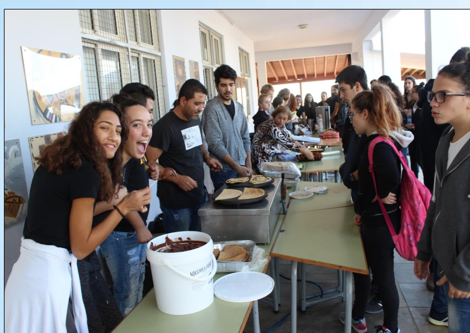
Φιλανθρωπική εκδήλωση σε συνεργασία με Σύνδεσμο Γονέων