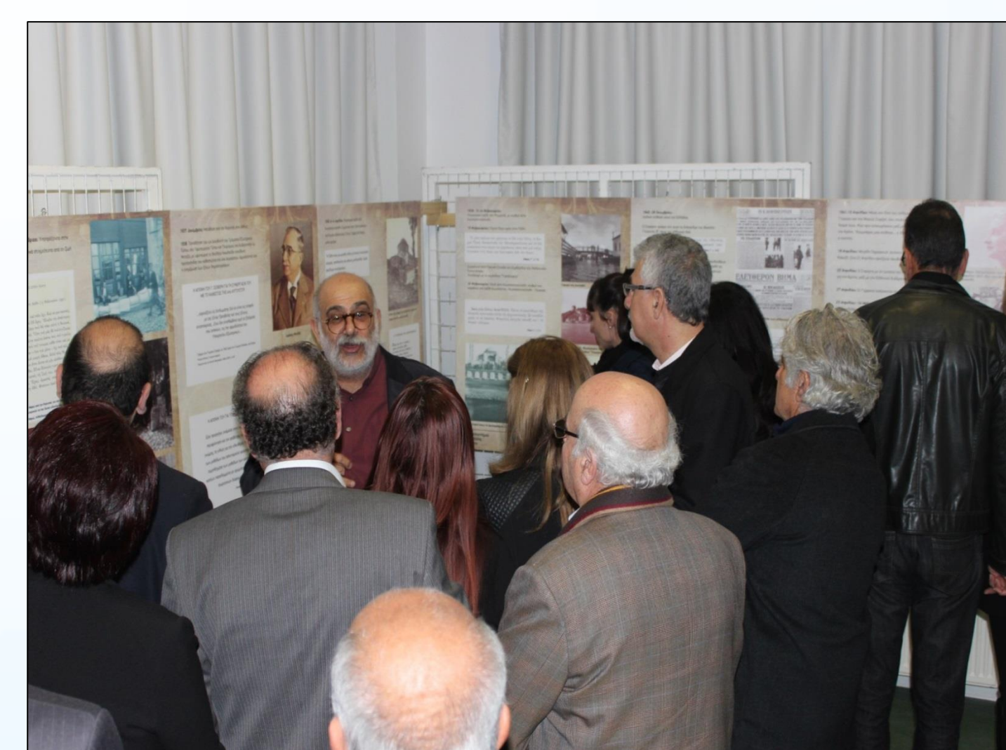
Έκθεση Φωτογραφίας «Για τον Σεφέρη» σε συνεργασία με το Πανεπιστήμιο «Νεάπολις»