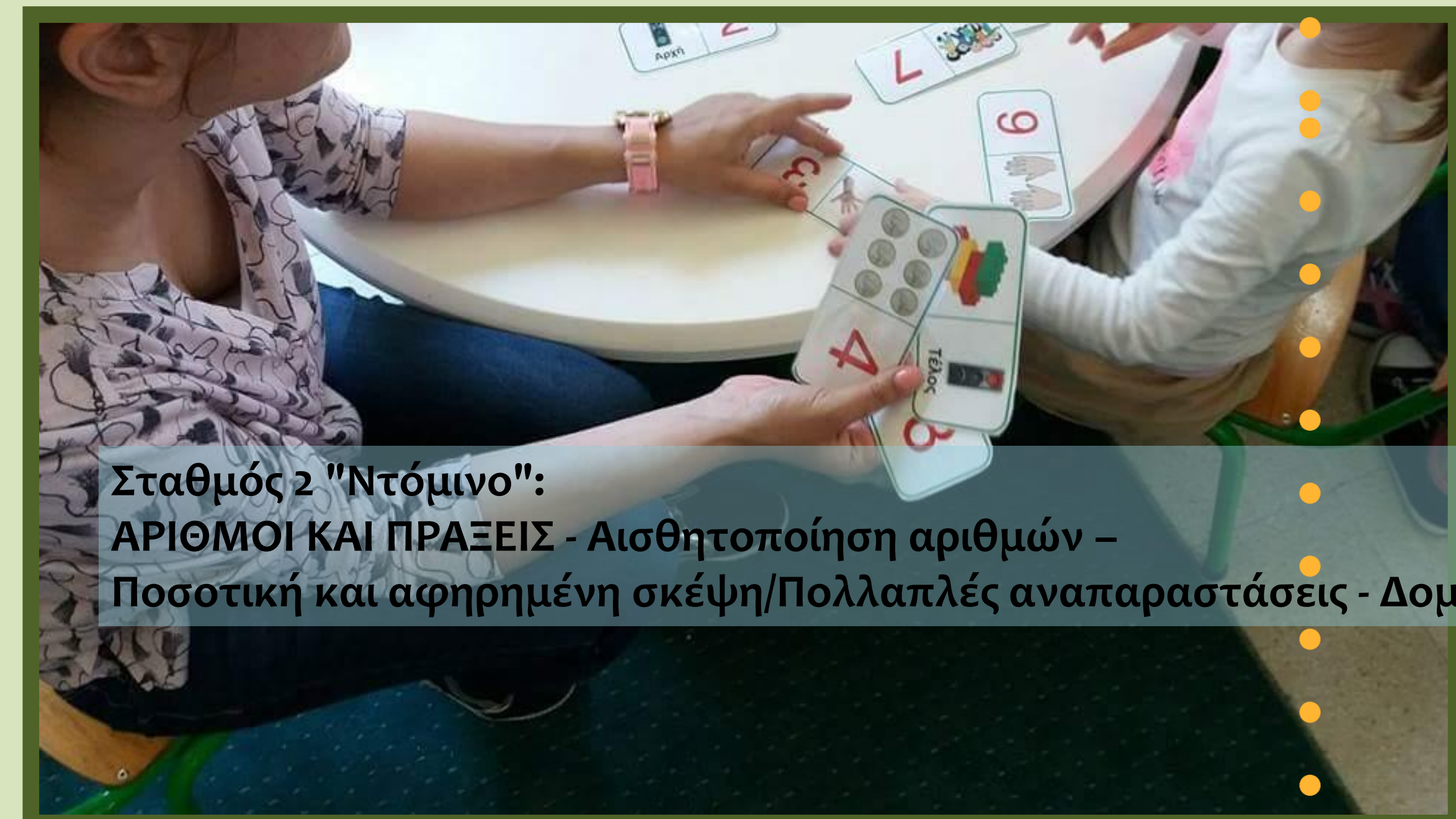
Σταθμός 2 "Ντόμινο": ΑΡΙΘΜΟΙ ΚΑΙ ΠΡΑΞΕΙΣ - Αισθητοποίηση αριθμών - Ποσοτική και αφηρημένη σκέψη/Πολλαπλές αναπαραστάσεις - Δομή