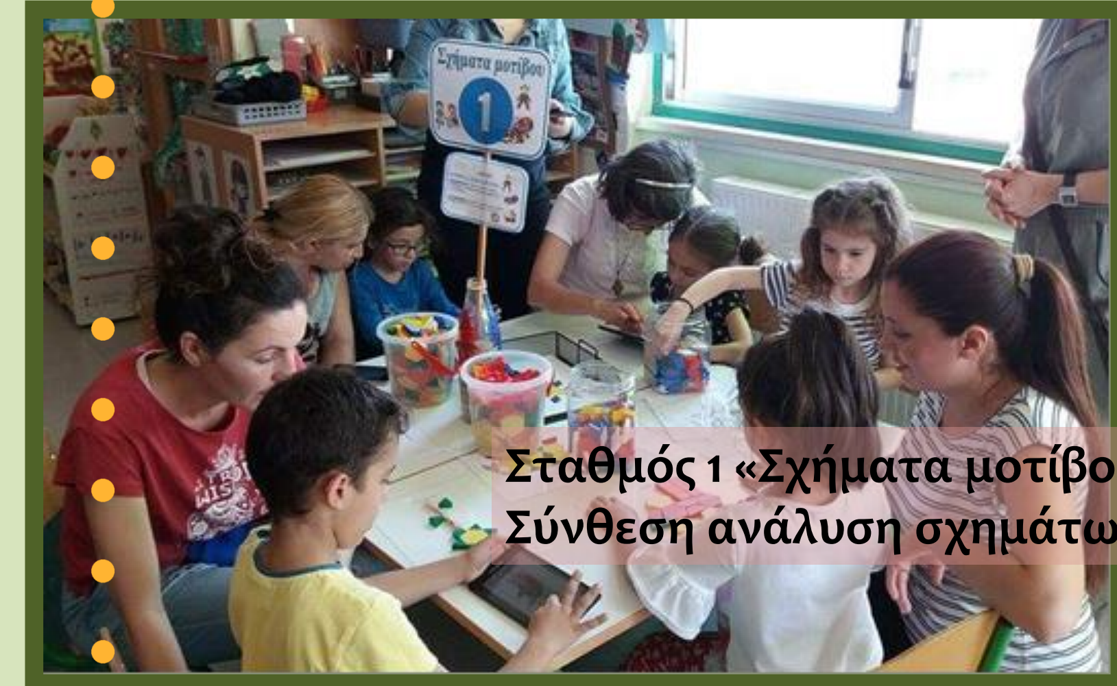
Σταθμός 1 «Σχήματα μοτίβου»: Σύνθεση ανάλυση σχημάτων - Λύση προβλήματος