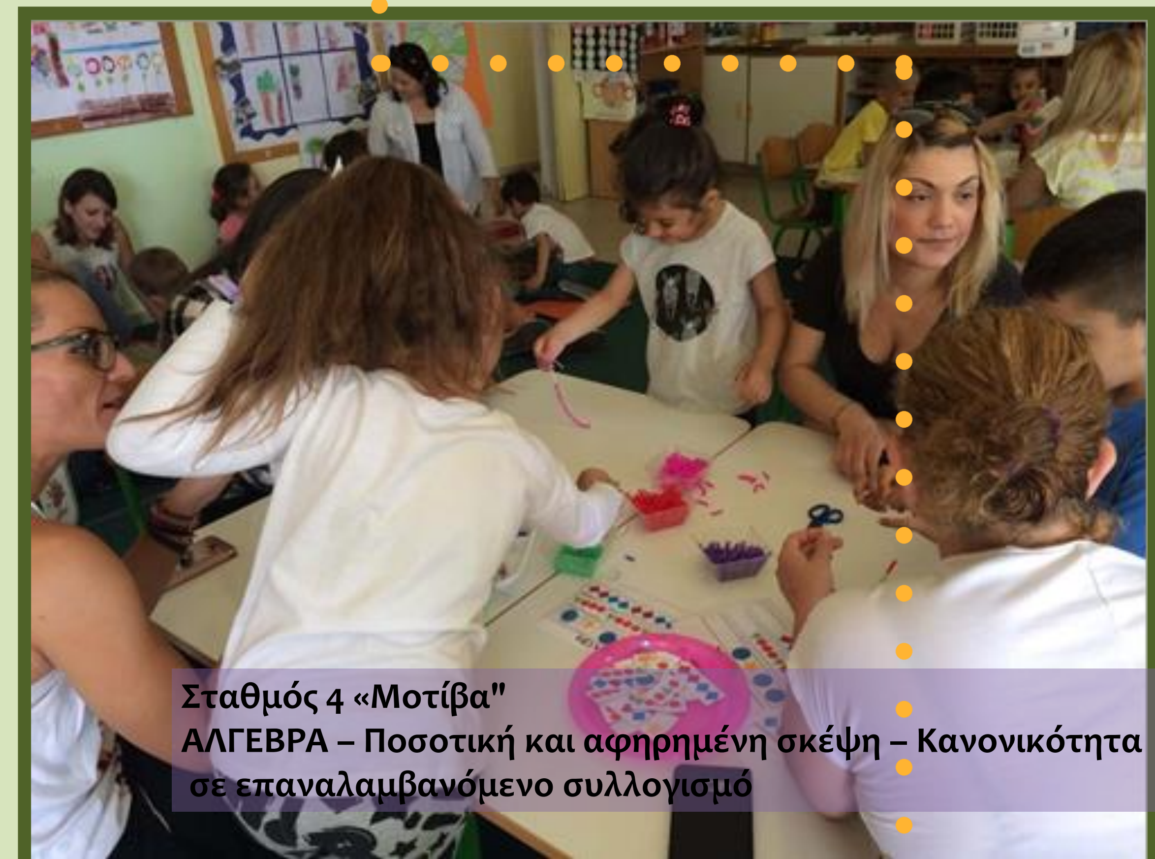
Σταθμός 4 «Μοτίβα" ΑΛΓΕΒΡΑ - Ποσοτική και αφηρημένη σκέψη - Κανονικότητα σε επαναλαμβανόμενο συλλογισμό