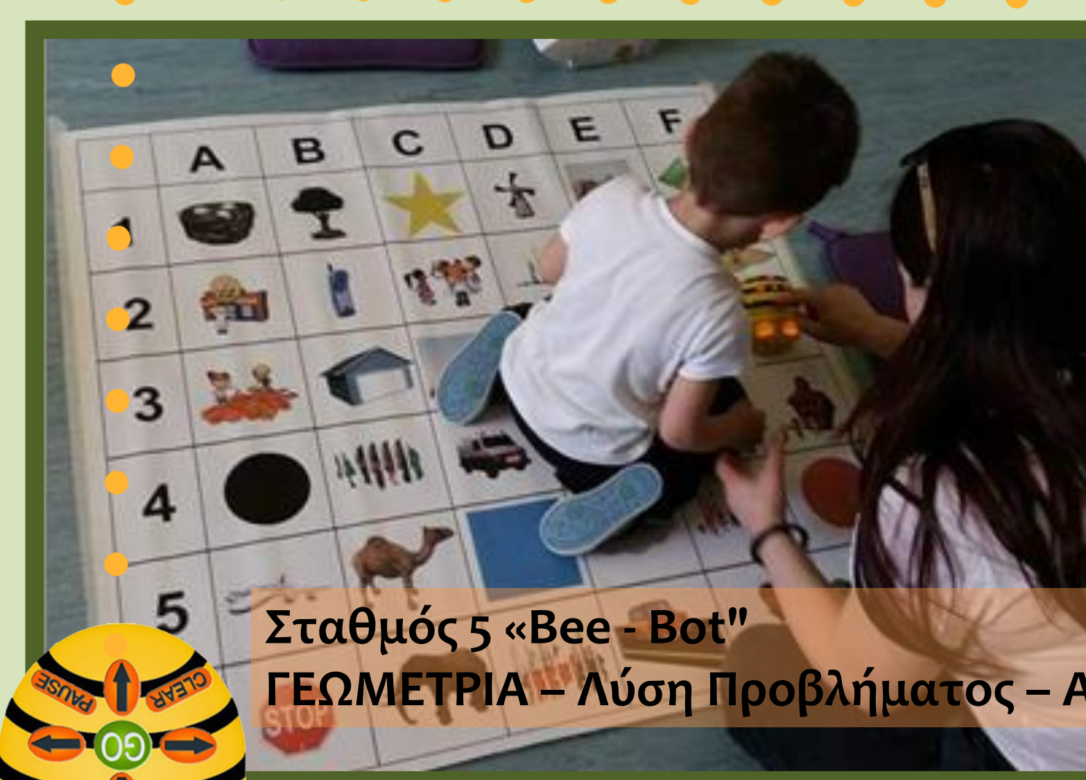
Σταθμός 5 «Bee - Bot" ΓΕΩΜΕΤΡΙΑ - Λύση Προβλήματος - Ανάπτυξη Ισχυρισμών