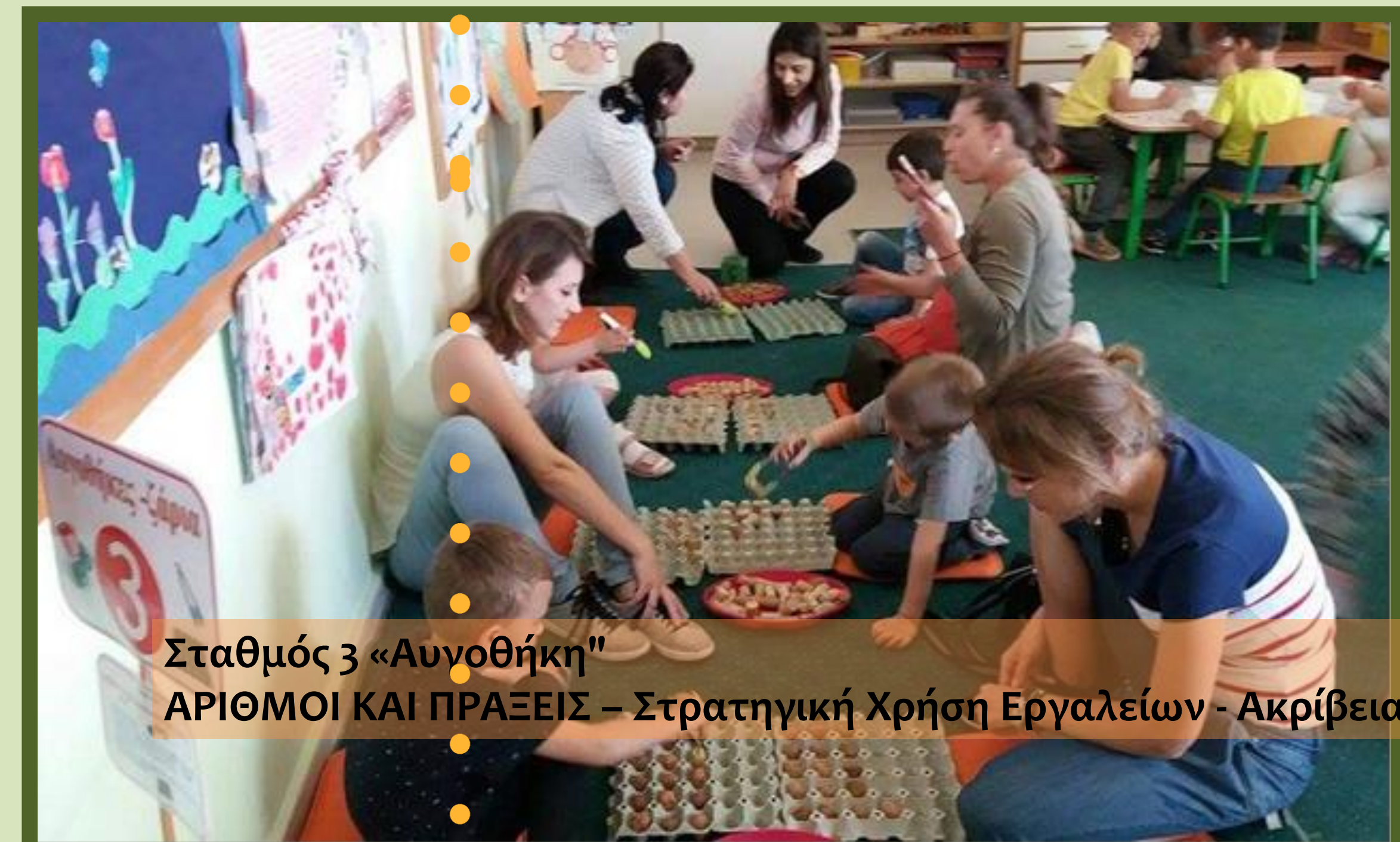
Σταθμός 3 «Αυγοθήκη" ΑΡΙΘΜΟΙ ΚΑΙ ΠΡΑΞΕΙΣ - Στρατηγική Χρήση Εργαλείων - Ακρίβεια