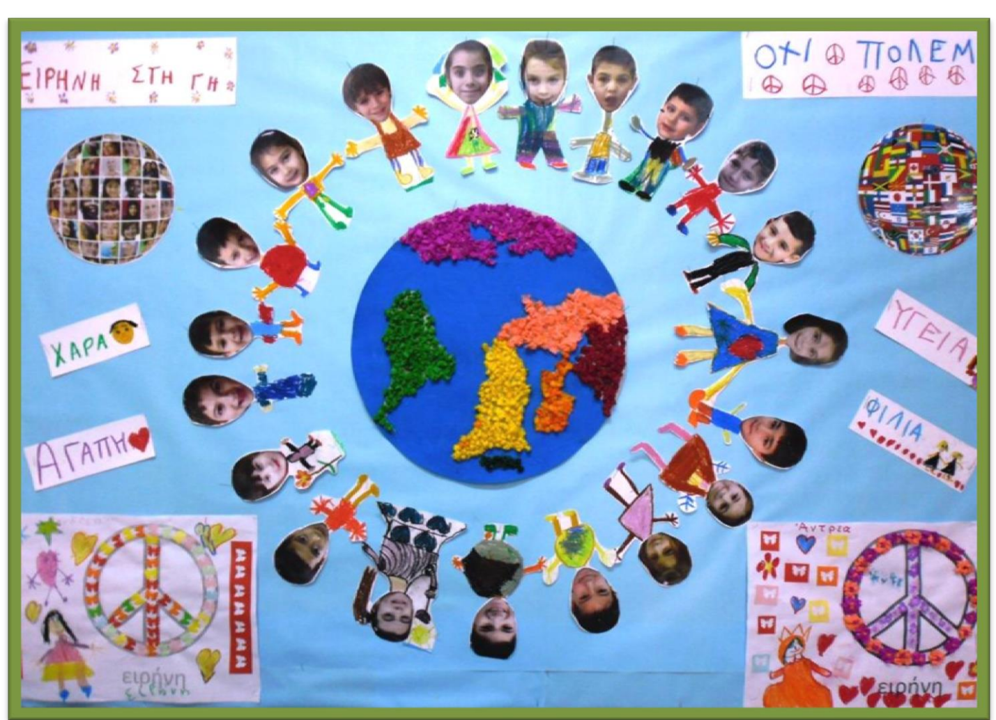
Φτιάξαμε με τους εαυτούς μας μια πινακίδα και στη συνέχεια διηγήθήκαμε τις δικές μας ιστορίες.

Παραδείγματα στόχων: Τα παιδιά να: 1. Αναπτύξουν τον ποιοτικό προφορικό λόγο, μέσα από υπόδυση ρόλων, ακρόαση κειμένων, ποιημάτων, δημιουργική αναπαραγωγή κειμένων και δημιουργία αυτοσχέδιων κειμένων (ιστοριών, προσευχών) 2. Μεταφέρουν μηνύματα, οδηγίες και γνώσεις σε άλλους. 3. Περιγράφουν εικόνες 4. Αφηγούνται γεγονότα Οι γονείς και οι εκπαιδευτικοί να: Επιμορφωθούν σε θέματα γλωσσικής ανάπτυξης μέσα από βιωματικό εργαστήριο και διάλεξη