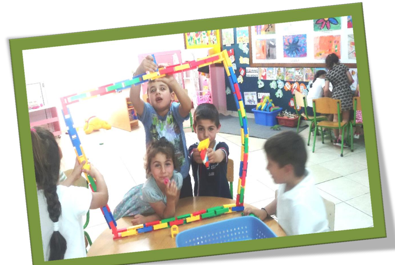
Γίναμε δημοσιογράφοι και μεταδώσαμε τις δικές μας ειδήσεις.