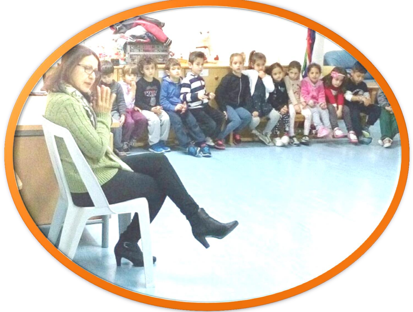
Πήραμε συνέντευξη από την κοινοτάρχη της κοινότητάς μας.