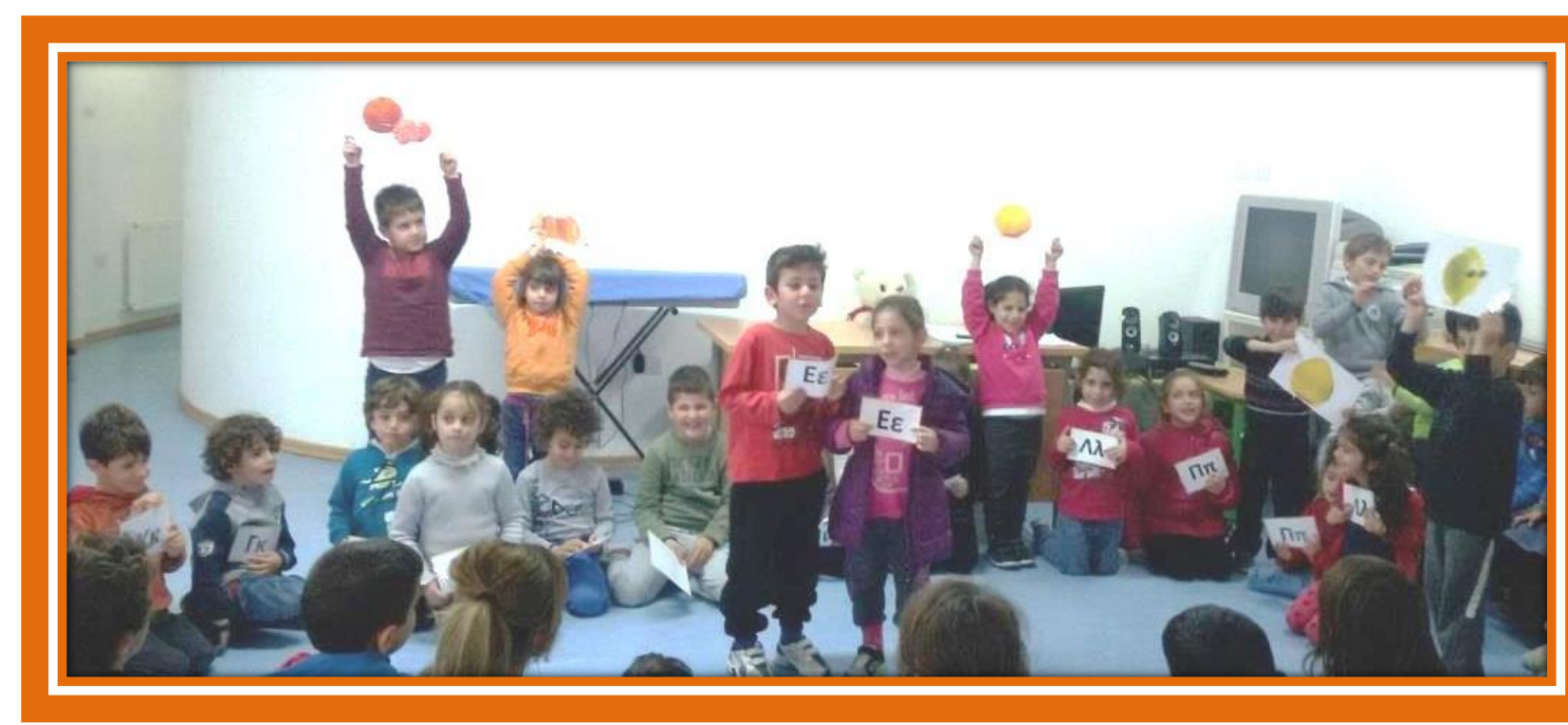
Παρουσιάσαμε στους φίλους μας τα δικά μας ποιήματα για τα δέντρα.