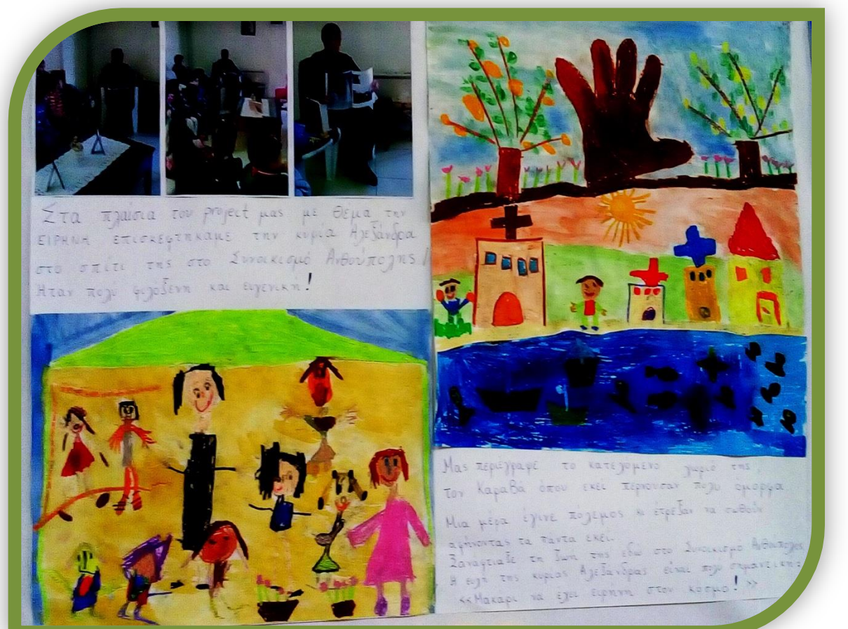
Δημιουργήσαμε τη δική μας αφίσα με πληροφορίες που συλλέξαμε από άτομα του συνοικισμού, με θέμα τον πόλεμο και την προσφυγιά.