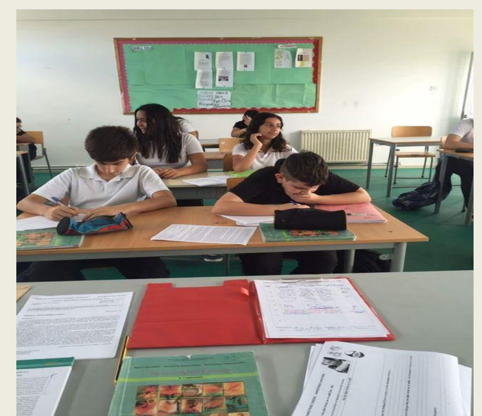
Δειγματική διδασκαλία στο μάθημα της Νεοελληνικής Γλώσσας