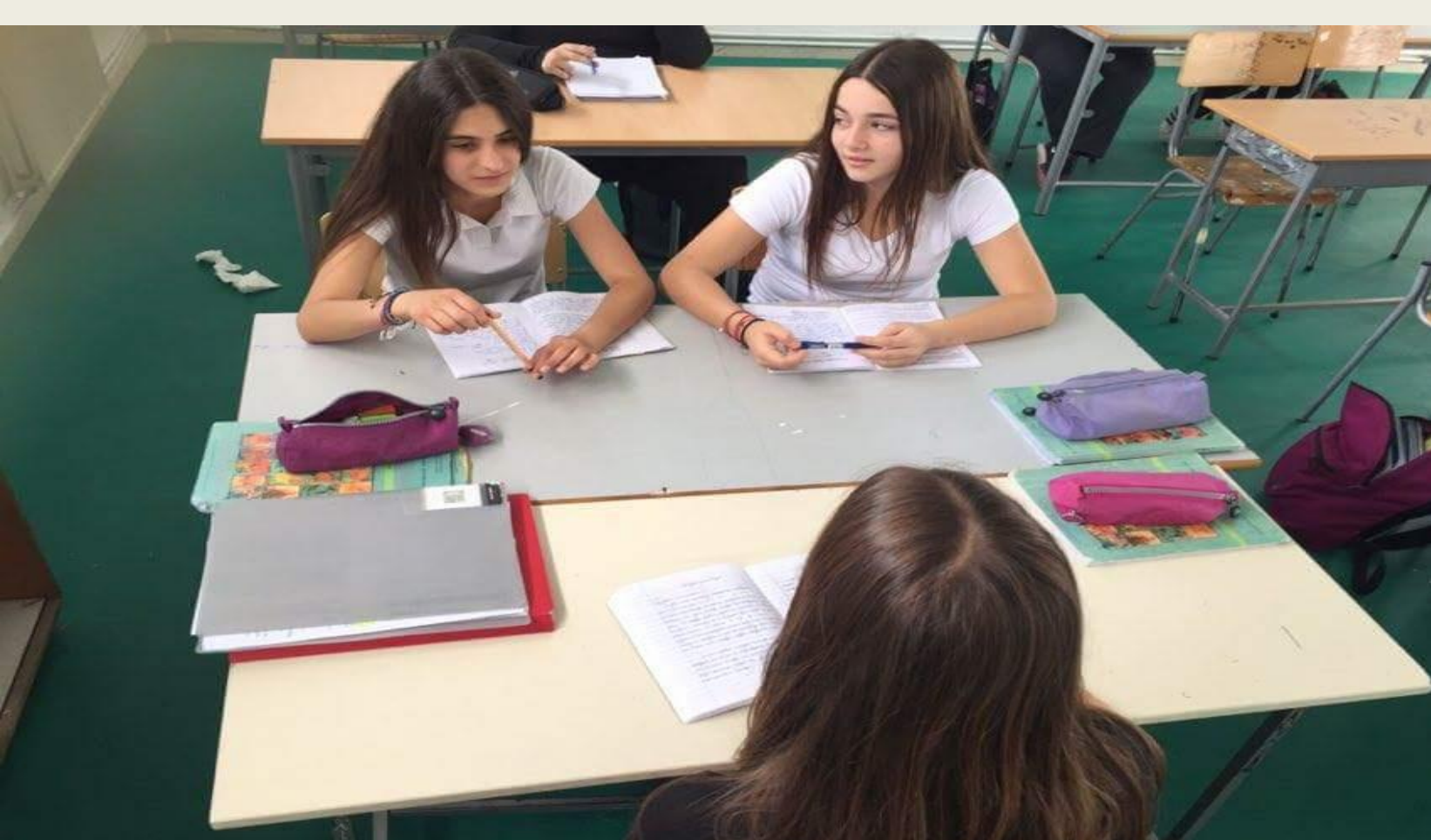
Δειγματική διδασκαλία στο μάθημα της Νεοελληνικής Γλώσσας