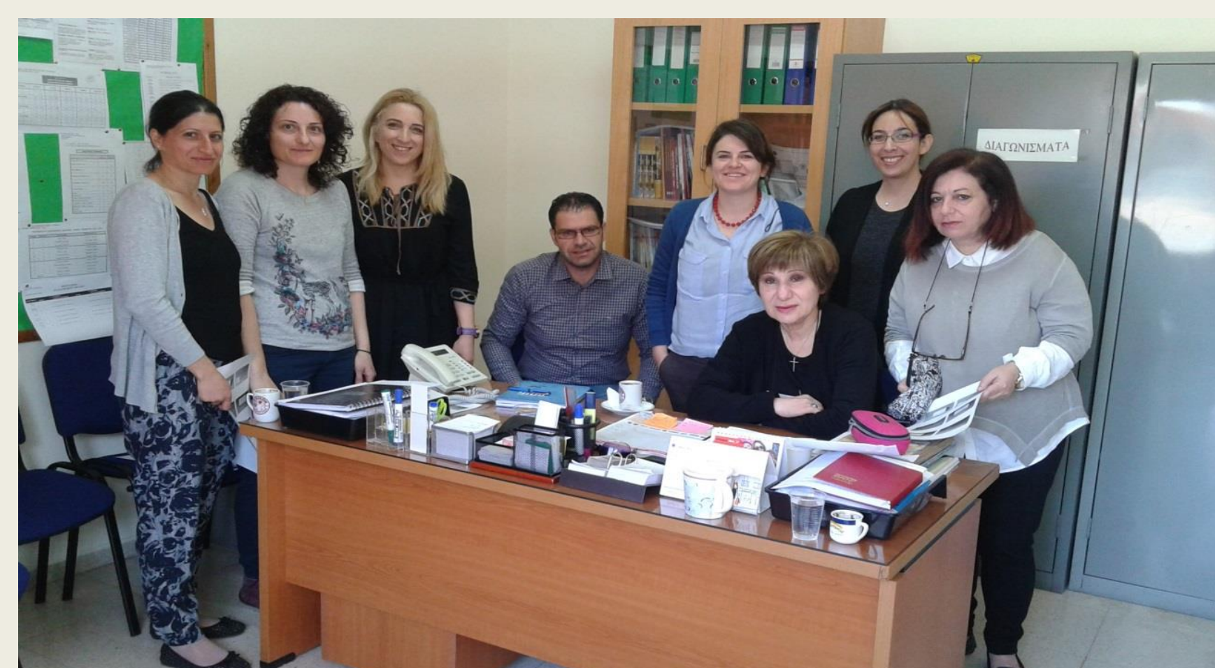
Η ομάδα Φιλολόγων του Σχολείου με τη Συντονίστρια και τον Υποστηρικτή του Σχολείου