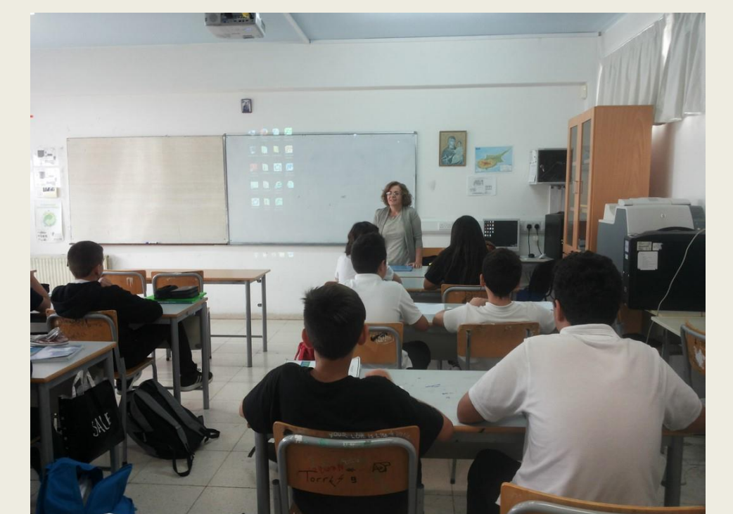
Δειγματική διδασκαλία με διαφοροποίηση