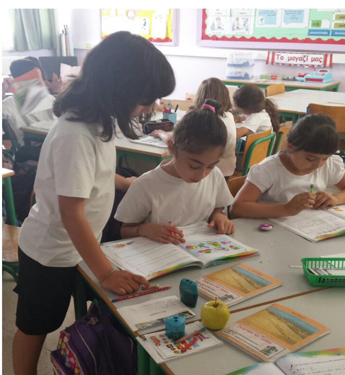
Διδασκαλία από συμμαθητές