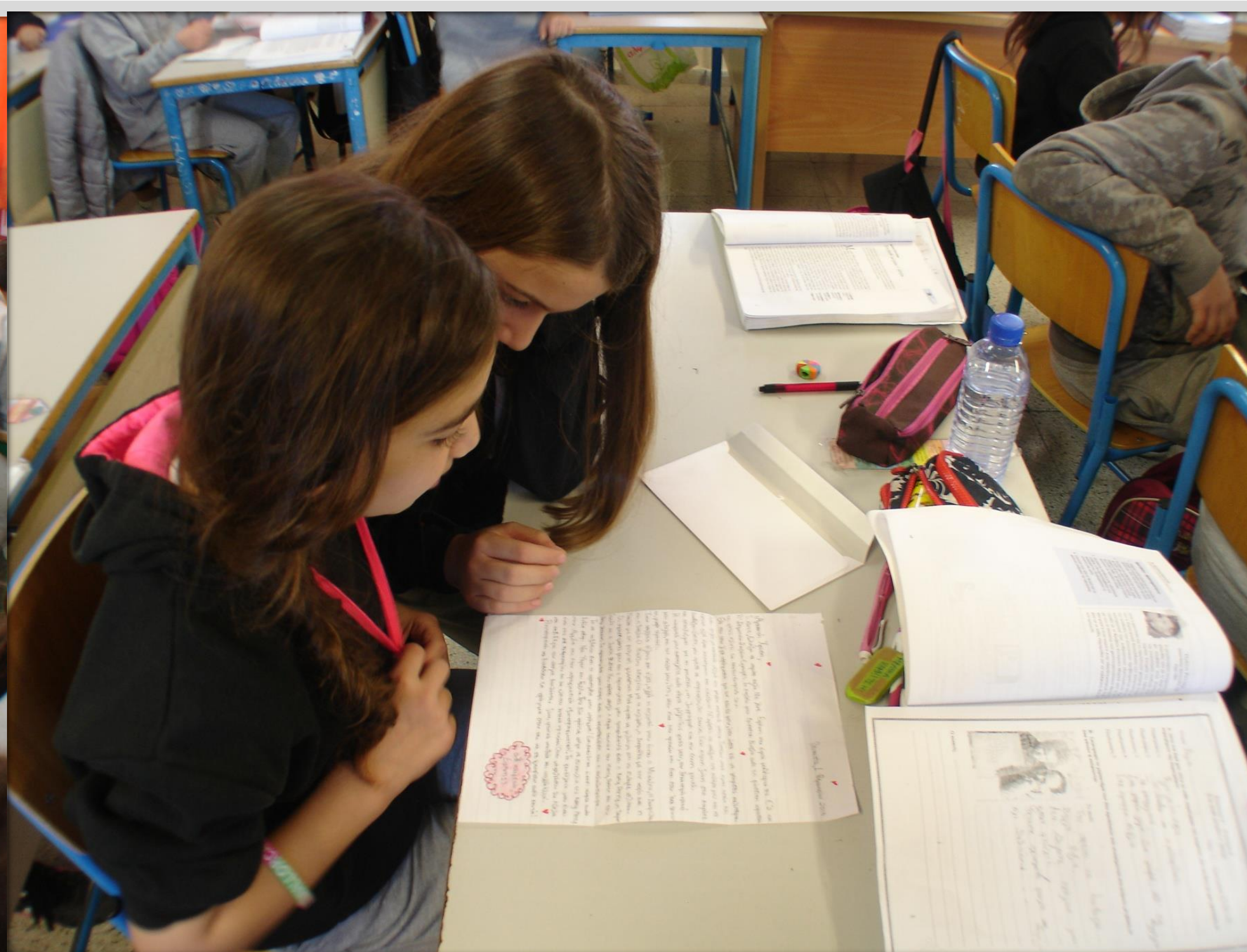
Αλληλογραφία με παιδιά του Α´ Δημ. Σχολ. Έγκωμης