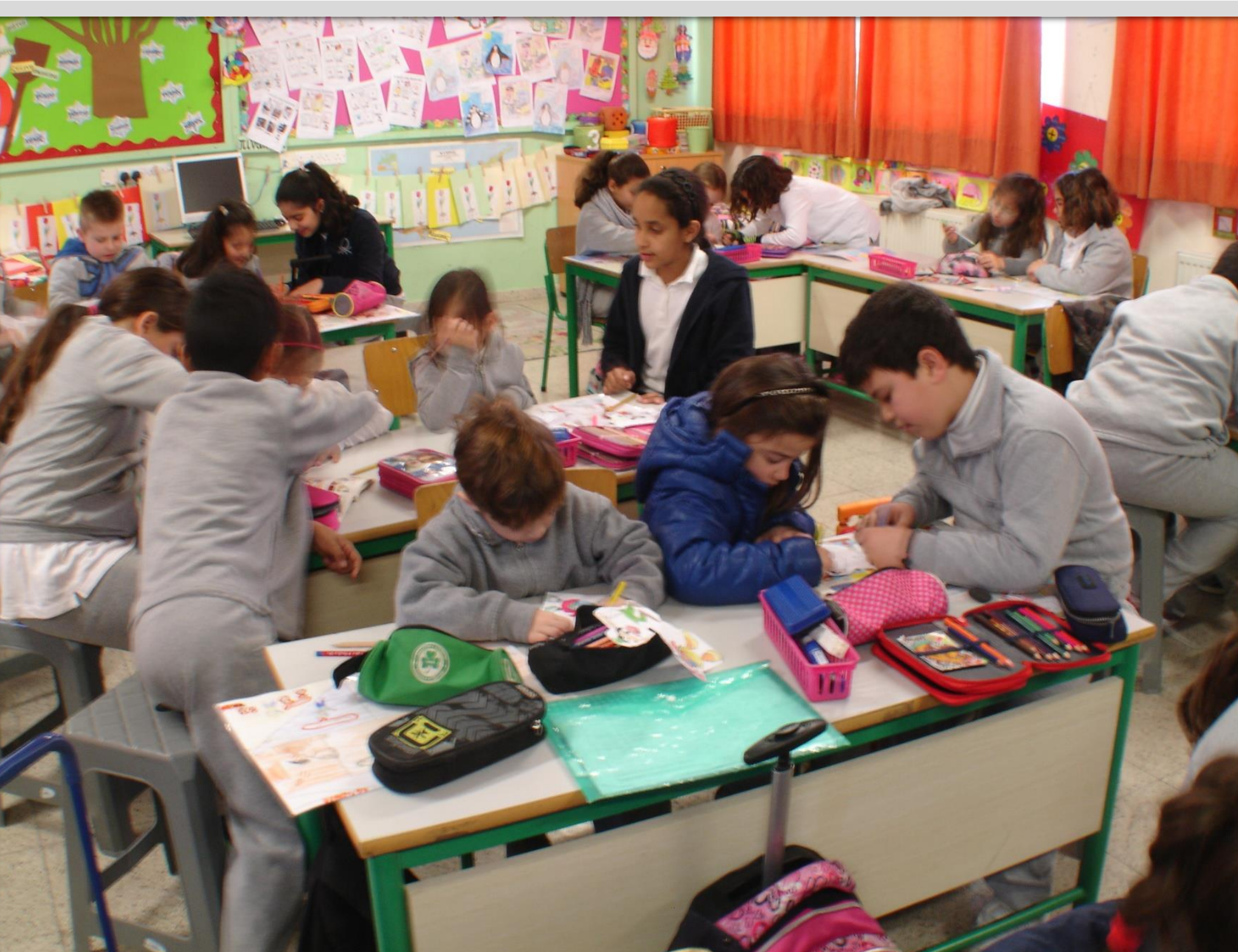
Συνδιδασκαλία Δ´-Α´ τάξης