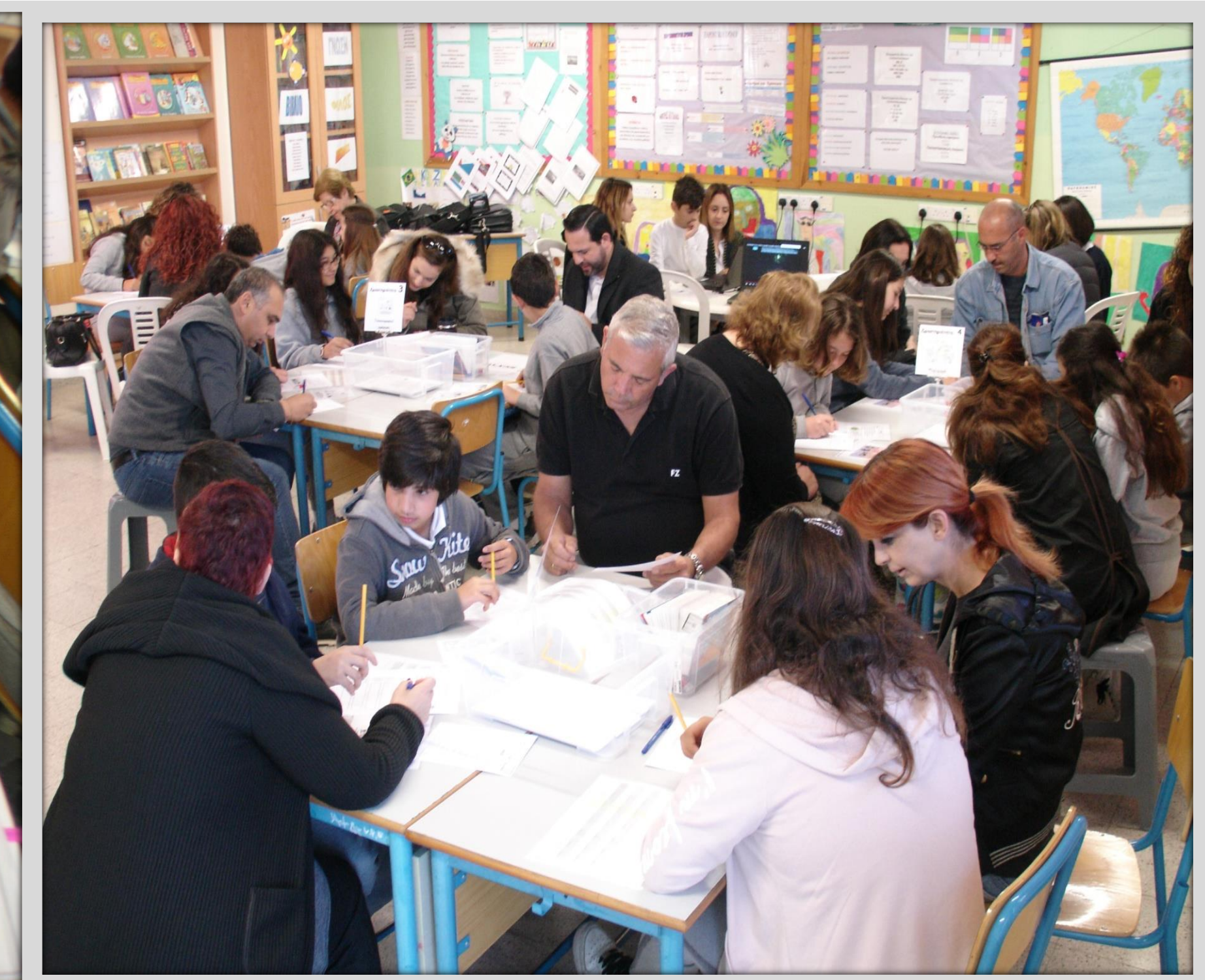
Βιωματικό εργαστήριο με γονείς