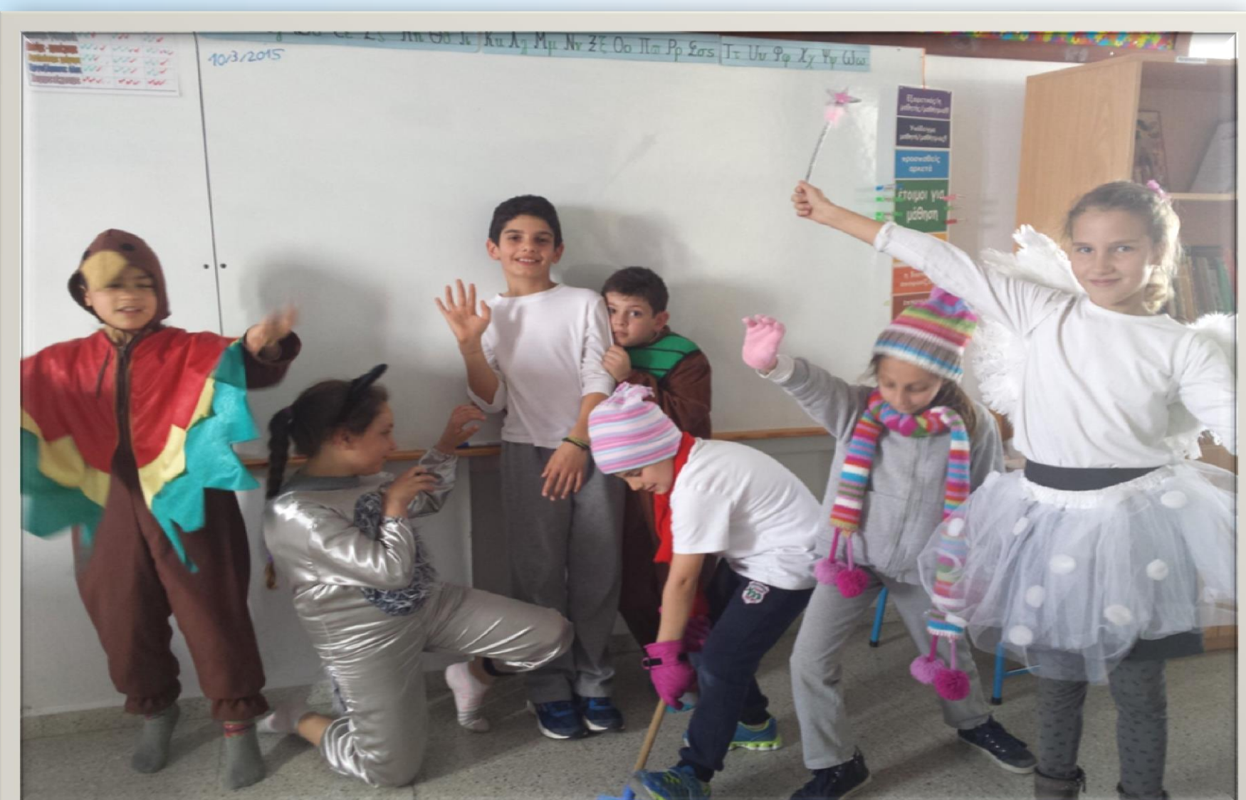
Η συμμετοχή των παιδιών σε θεατρικές συμβάσεις με σκοπό την καλλιέργεια του προφορικού λόγου, τη συνεργασία, τη βελτίωση της εκφραστικής ικανότητας και τη δημιουργία ευχάριστου κλίματος μάθησης.