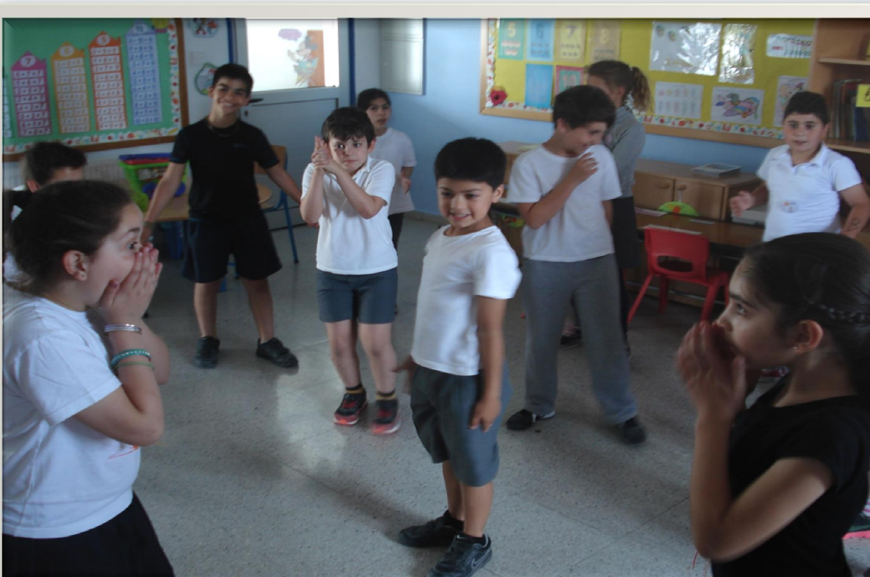
Εμπλουτισμός των μαθημάτων με παιγνιώδεις δραστηριότητες για βελτίωση του προφορικού λόγου.