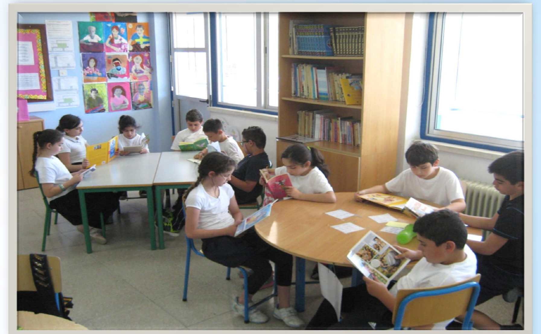
Η καλλιέργεια της φιλαναγνωσίας με σκοπό τον εμπλουτισμό του λεξιλογίου των παιδιών.