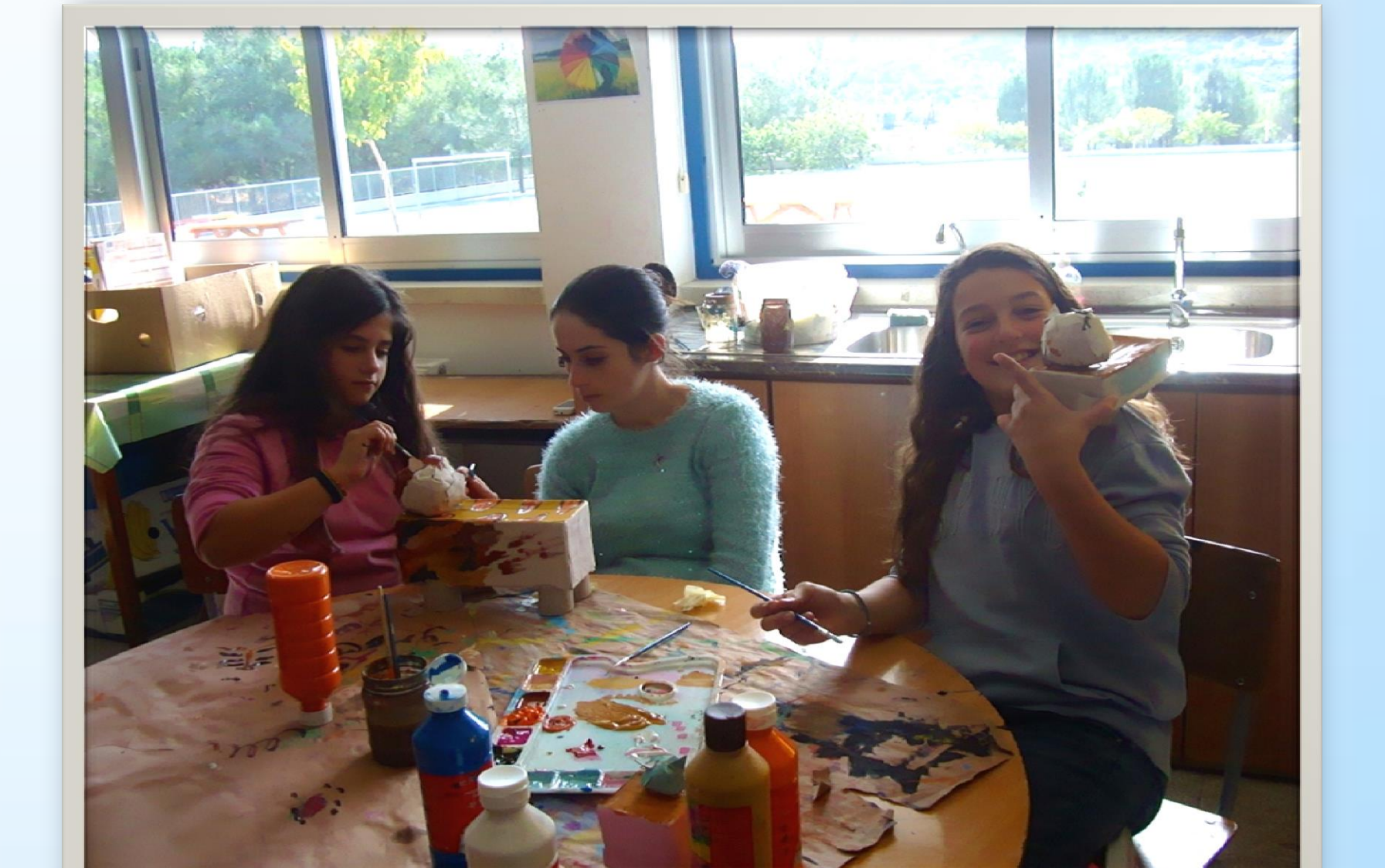
Εμπλοκή και αξιοποίηση των γονιών στα πλαίσια του μαθήματος της Τέχνης.