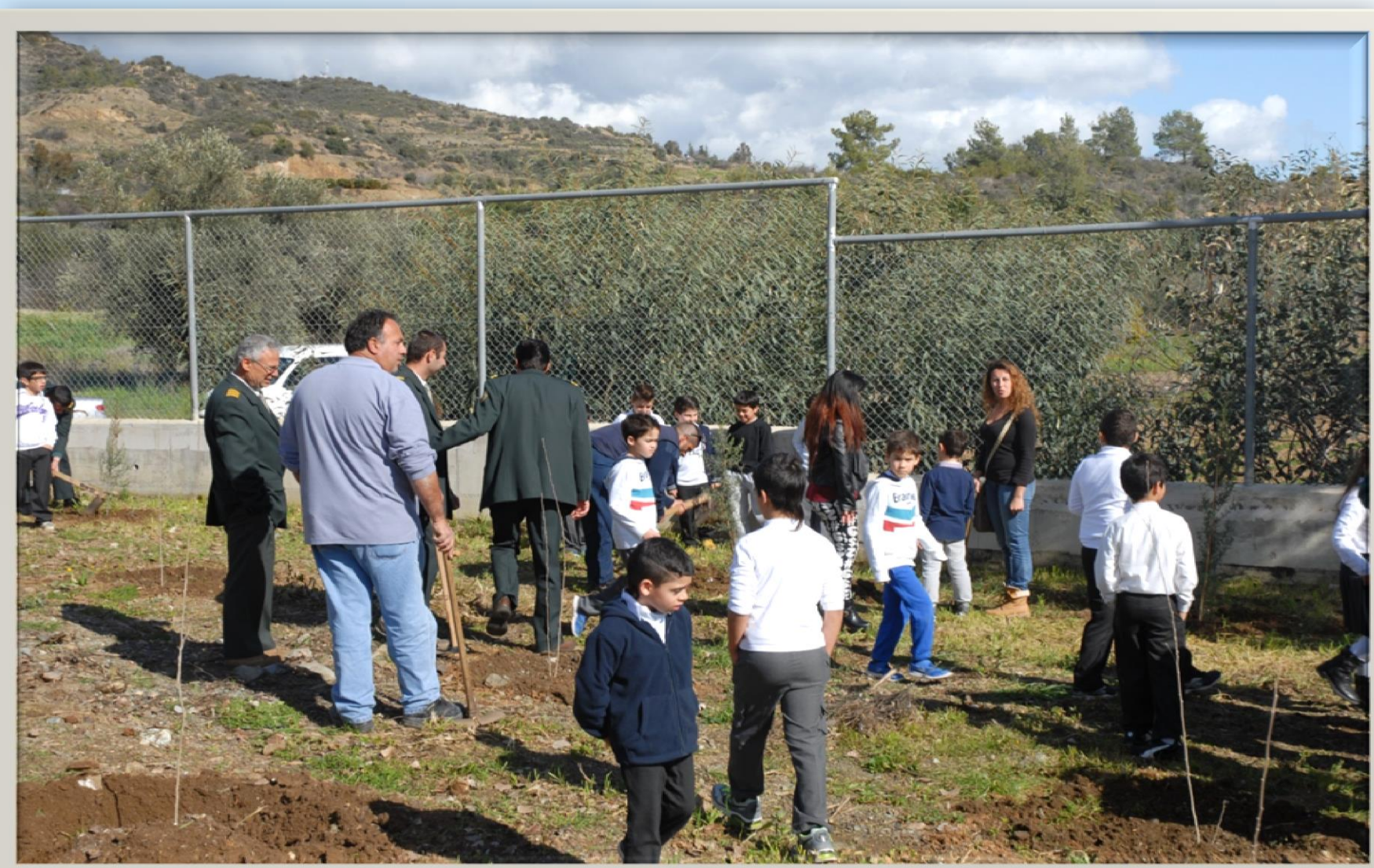
Διοργάνωση εκδήλωσης για τη γιορτή του δέντρου η οποία περιλάμβανε δεντροφύτευση με εμπλοκή των γονέων.