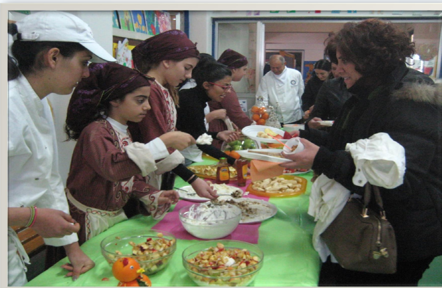
Διοργάνωση εκδήλωσης με θέμα την υγιεινή διατροφή κατά την οποία ετοιμάστηκε υγιεινό πρόγευμα με τη συμβολή των γονέων.