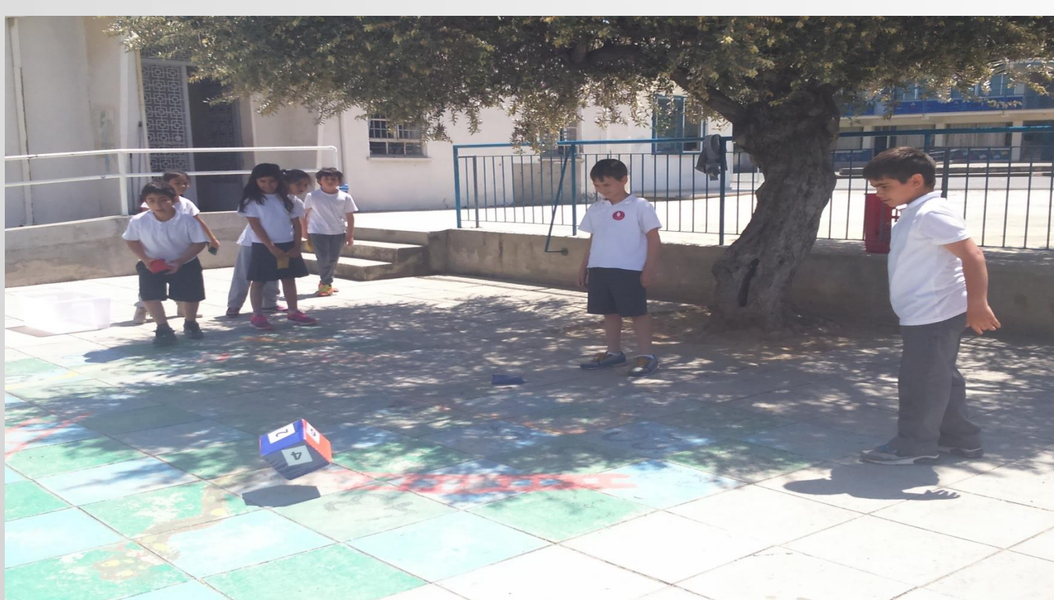
Βάζουμε κανόνες στα παιχνίδια μας και τους ακολουθούμε πιστά.

Γνωρίζουμε καλύτερα τους συμμαθητές μας και τα ενδιαφέροντά τους.