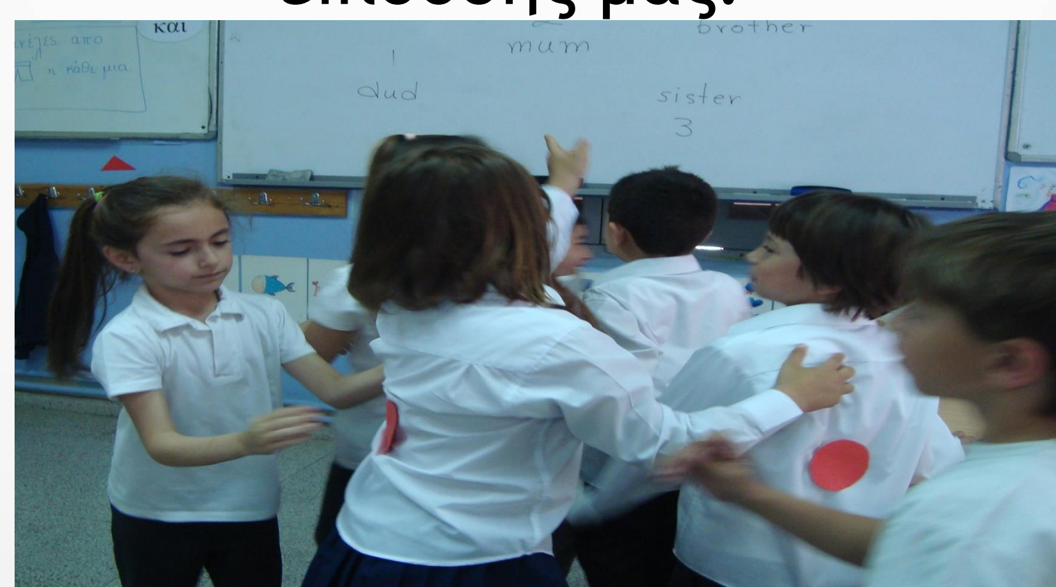
Παίζουμε παιχνίδια συνεργασίας στην τάξη.