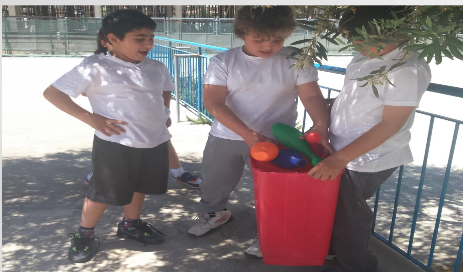
Τηρούμε τις υπευθυνότητές μας.