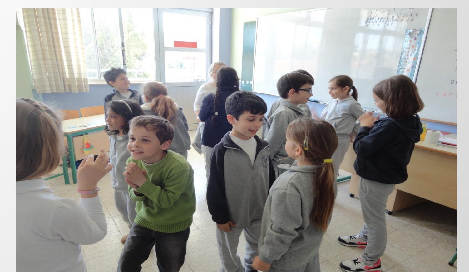
Ασχολούμαστε με παιγνιώδεις δραστηριότητες στο μάθημα.