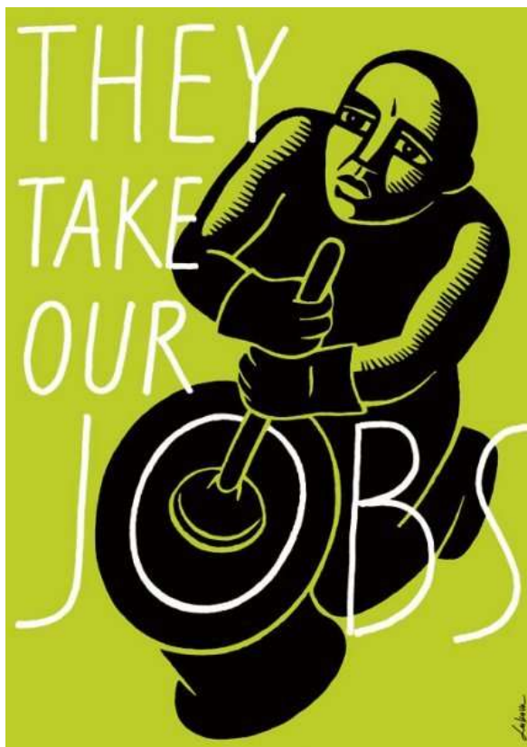
Διεθνής έκθεση αφισών «30 αφίσες για τη Μετανάστευση»