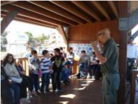
Περιβαλλοντικό Κέντρο Ακρωτηρίου