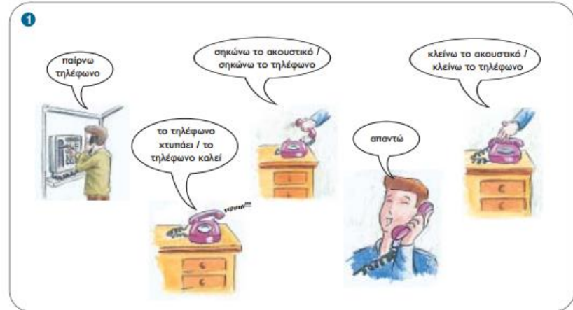
Ο τηλεφωνικός διάλογος / Η τηλεφωνική συνομιλία