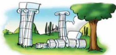
• αρχαία μνημεία