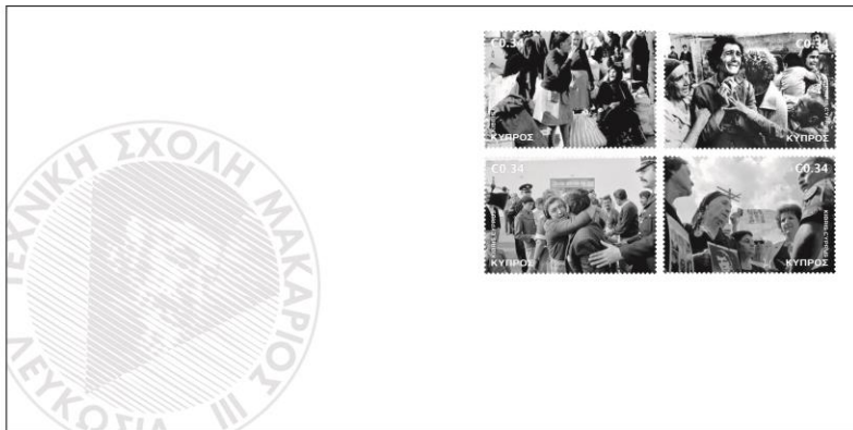
Βασιλείου Τιμόθεος, ΘΠΑ3

Οι προαναφερθέντες στόχοι υλοποιήθηκαν σε σημαντικό βαθμό, κατά την άποψή μας, εφόσον στο τέλος προέκυψαν αρκετές εργασίες - εικαστικής φύσεως οι πλείστες -, όπως αφίσες, κάρτες, γραμματόσημα, παρουσιάσεις στο ηλεκτρονικό πρόγραμμα παρουσιάσεων (Power Point), μικρές διερευνητικές εργασίες, σταυρόλεξο, κρυπτόλεξο.