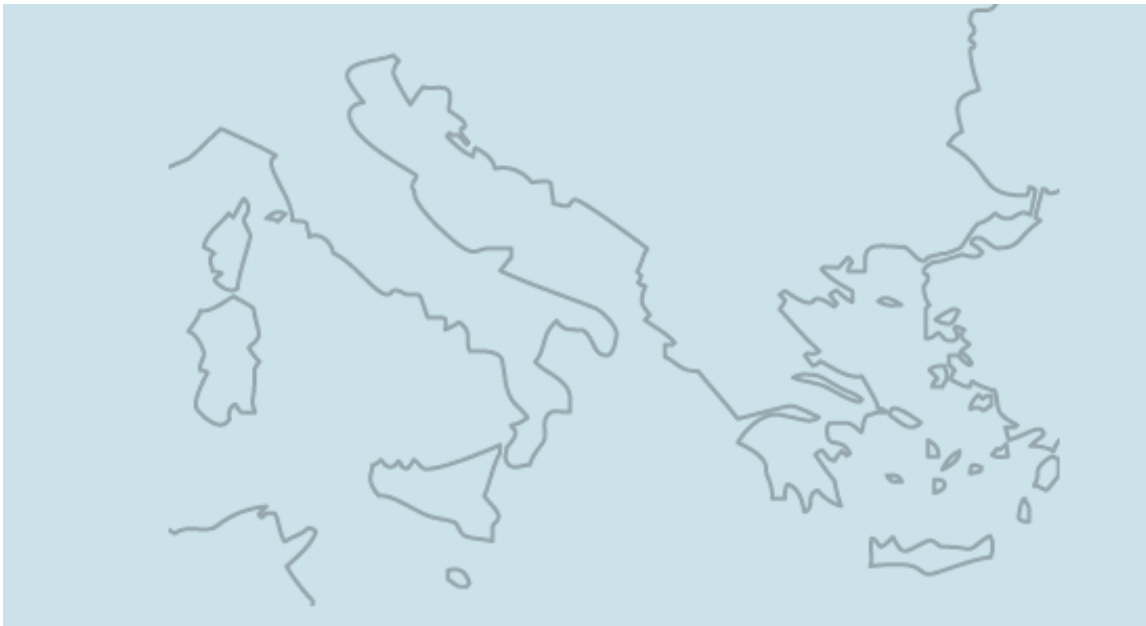
Χάρτης της Μεσογείου (σήμερα)

Μεγάλη Ελλάδα: η επικράτεια των διαφόρων αρχαίων Ελληνικών αποικιών στη Σικελία και Νότια Ιταλία.