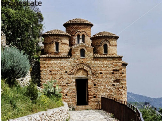
Η εκκλησία Κατόλικά, 10 ος αι. μ.Χ.