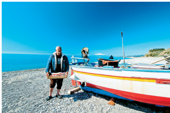
Σύγχρονες ασχολίες των κατοίκων της περιοχής, όπου ερμηνεύεται το τραγούδι «Καληνύφτα»