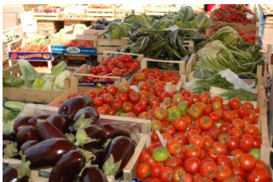
Αγορά της περιοχής