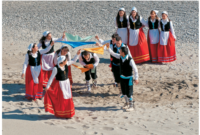
Παραδοσιακές στολές χορευτικού συγκροτήματος

Παραδοσιακή ενδυμασίες κατοίκων, στις αρχές του 20ού αι.