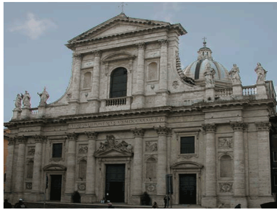
Η εκκλησία του Σαν Φραγκέσκο, 17ος αι. μ.Χ.