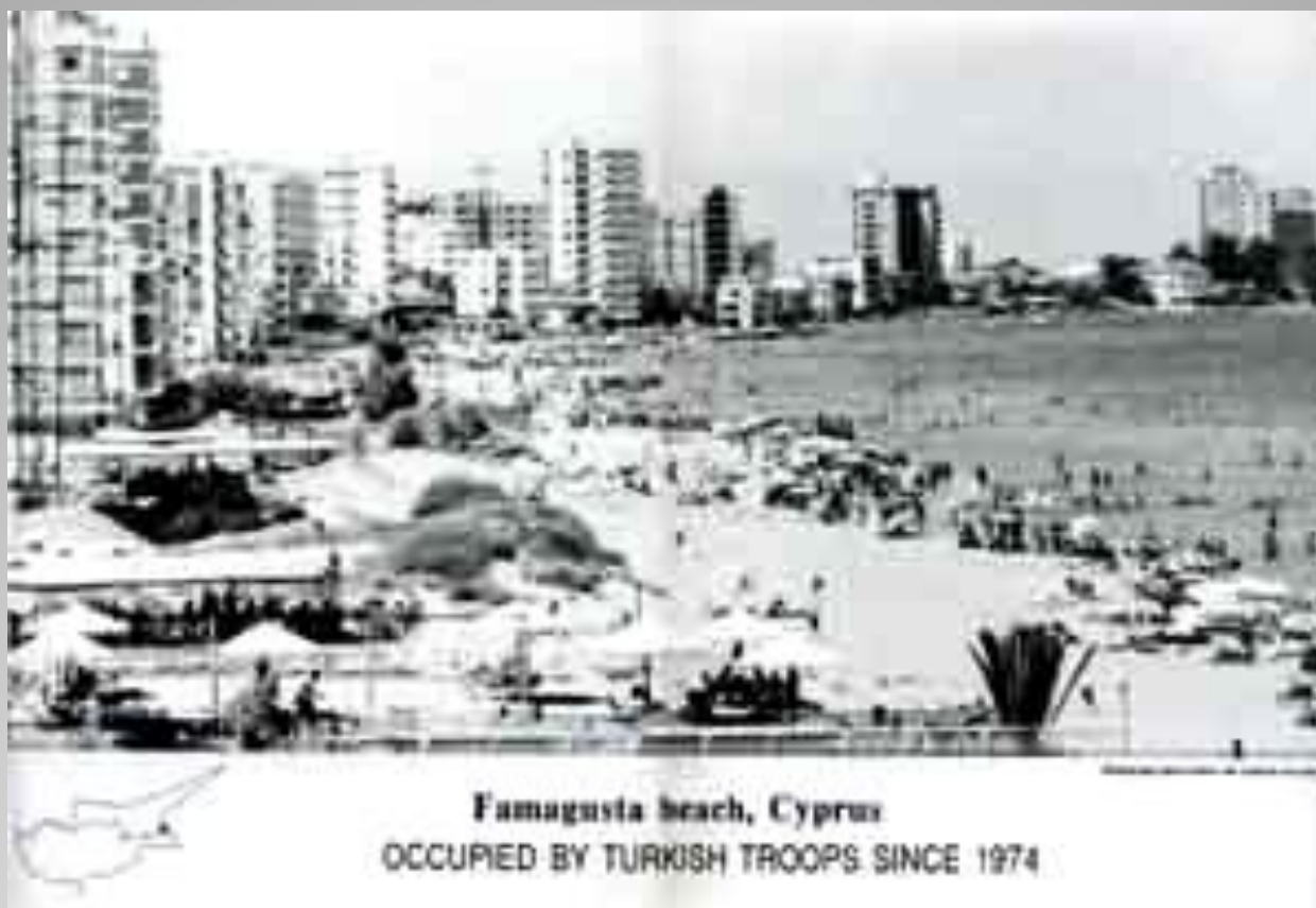
Famagusta beach, Cyprus OCCUPIED BY TURKISH TROOPS SINCE 1974

«Πού πήγε η μέρα η δικοπη που είχε τα πάντα αλλάξει; Δε θα βρεθεί ένας ποταμός να 'ναι για μας πλωτός;» Στροφή, Γιώργος Σεφέρης