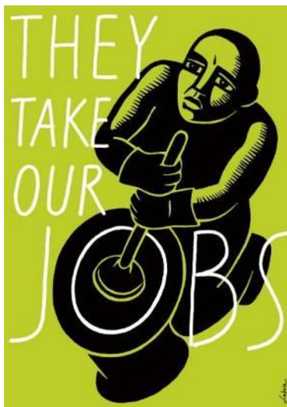
Διεθνής έκθεση αφισών «30 αφίσες για τη Μετανάστευση», gsociety.wordpress.com