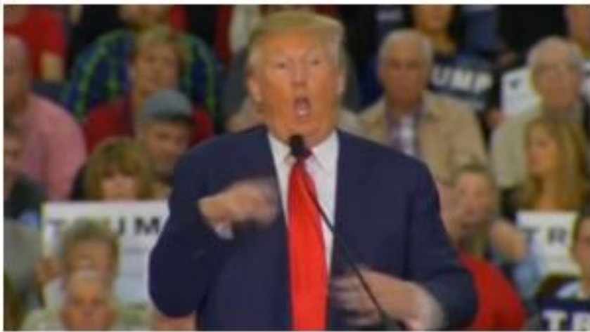
Donald J. Trump, campaigning in 2015 when he made fun of a disabled reporter.