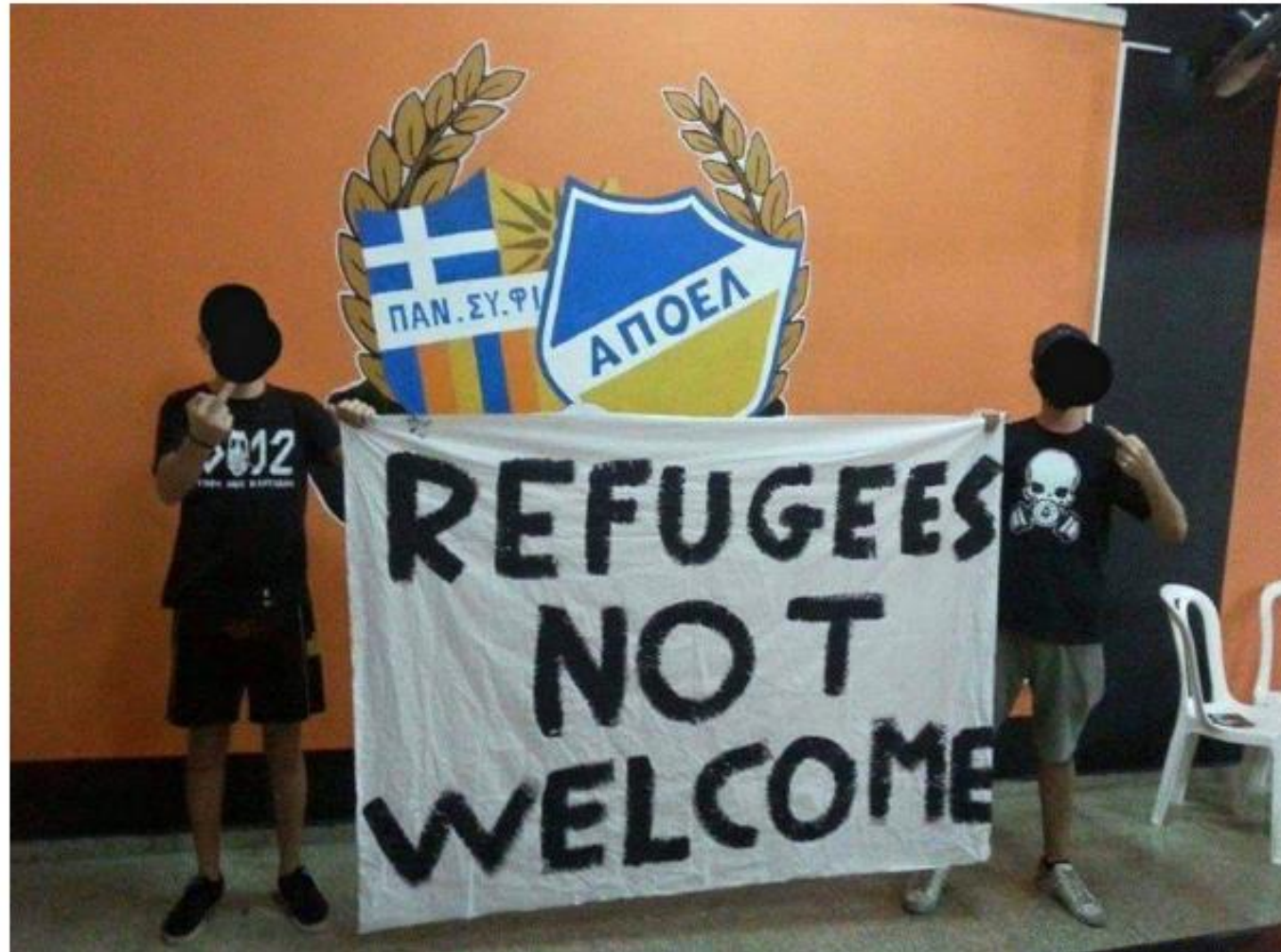
Αστυνομία στη Λάρνακα.