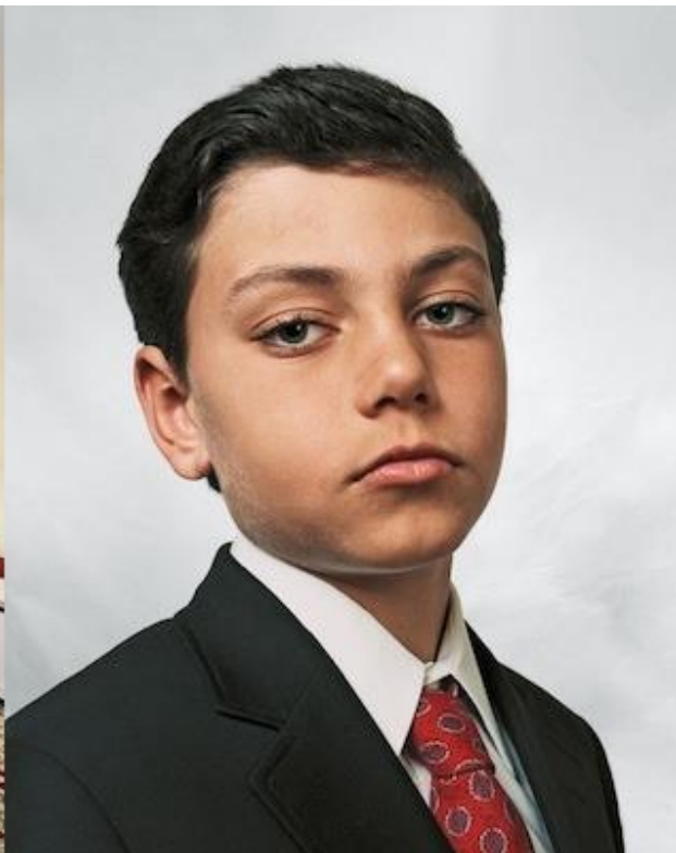
Στην Παλαιστίνη: Η Ντούχα 10 χρόνων