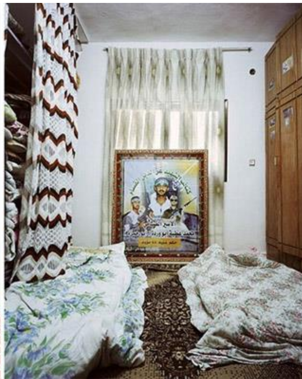
Επιμέλεια-Προσαρμογή: Ήβη Κουράτου, Λειτουργός Π.Ι.