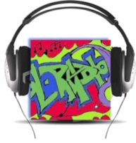
ΕΠΙΣΤΗΜΟΝΙΚΗ ΕΤΑΙΡΕΙΑ «European School Radio, Το Πρώτο Μαθητικό Ραδιόφωνο»